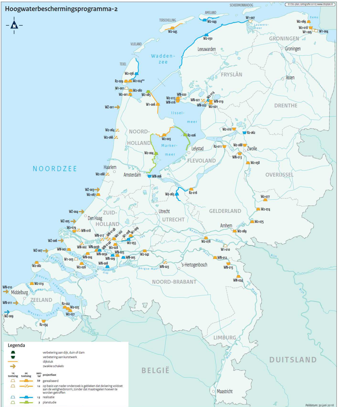
Figuur 2 Actuele scope van het programma, peildatum 30 juni 2016