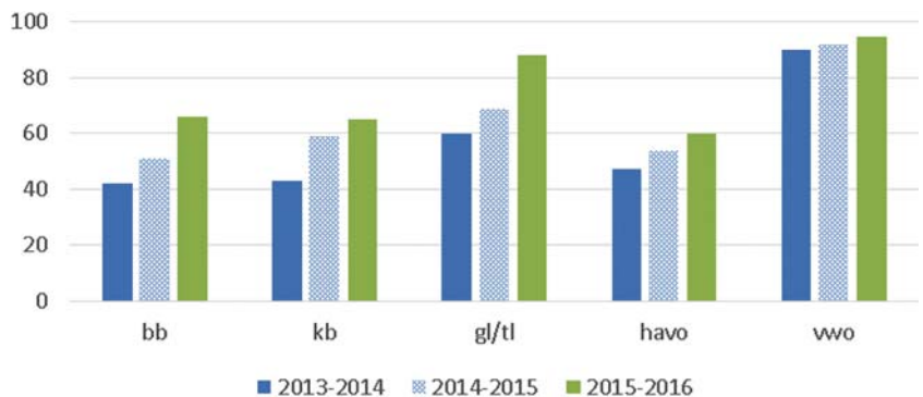
Grafiek 1: Percentage 6 of hoger als eindcijfer op de rekentoets van de eindexamenkandidaten in de schooljaren 2014, 2015 en 2016

Ook in de andere schoolsoorten zijn de rekenresultaten dit schooljaar verder verbeterd. In grafiek 1 is te zien dat de stijging in vmbo-gl/tl ten opzichte van voorgaande jaren het grootst is: het aantal kandidaten dat een voldoende heeft gehaald is met 20 procent gestegen naar 89 procent. Dit kan grotendeels verklaard worden doordat bij vmbo-gl/tl geen cijferdifferentiatie meer wordt toegepast. Verder is het voldoendepercentage en het percentage leerlingen met een 5 of hoger in het vmbo-bb sterk gestegen.