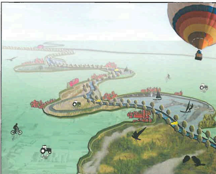
Figuur 1: het perspectief op de Meanderende Maas.

In het BO MIRT van 12 oktober 2016 is ingestemd met de start van een integrale verkenning voor Ravenstein-Lith. De start van de verkenning is onderdeel van een samenhangend pakket aan waterveiligheidsmaatregelen voor de gehele Maas. Dit pakket geeft invulling aan de urgente hoogwaterveiligheidsopgave en verbindt die met lokale ruimtelijke en economische ambities.