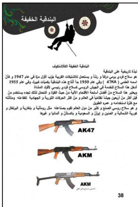
Pagina uit ISIS-lesboek over inzet en gebruik wapens

De lesboeken, zoals het basisschoolboek 'Ik ben moslim', onderbouwen een wereldbeeld waarbij de ideeën van ISIS juist zijn en alle andere onjuist. Lesmateriaal is geïllustreerd met afbeeldingen van handgranaten, tanks en gevechtsposities: zo wordt het onderwijs gekoppeld aan de militaire strategie van ISIS. Daarnaast krijgen kinderen theorieles over onderwerpen die met de strijd te maken hebben, zoals het herkennen van verschillende wapentypes, en in welke situatie deze het best ingezet kunnen worden. Een belangrijke focus in het curriculum is het versterken van het wij-zij-gevoel. De 'kruisvaarderscoalitie' (waar Nederland deel van uitmaakt) is hier de vijand die uitgeroeid zou moeten worden. 7 Iedereen die zich niet tegen de coalitie uitsprekt wordt bestempeld als ongelovige of, in het geval van moslims, als afvallige. Dit betekent volgens ISIS dat hij of zij gedood mag worden.