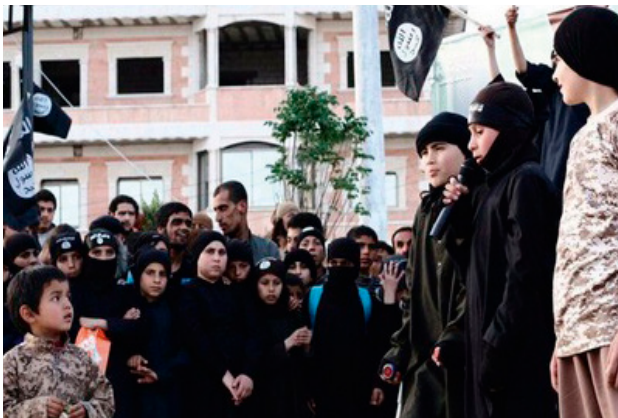
Minderjarige prediker in propagandavideo

Sommige minderjarigen vervullen een specifieke rol in het ‘kalifaat’: dit kan uiteenlopen van huisvrouw of verklikker tot soldaat of beul. Kinderen, zowel jongens als meisjes, worden aangespoord informatie te delen over familieleden, burens of vrienden die zich niet conformeren aan de regels van ISIS. Hierbij functioneert het ‘kalifaat’ als een totalitaire staat die controle wil over zijn burgers. De inzet van kinderen voor dergelijke rollen is gebruikelijk in een totalitair regime. Als de kinderen bewijzen loyaal aan ISIS te zijn, door deze rol naar behoren te vervullen, kunnen ze doorgroeien naar een rol met meer verantwoordelijkheid.