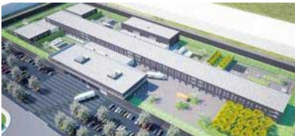
Afbeelding 1. Overzichtsfoto DCR

Het DCR is in 2010 gebouwd ten behoeve van vreemdelingenbewaring 7 . Het gebouw is echter zodanig ingericht dat verschillende doelgroepen en de wisselende vraag naar capaciteit binnen DJI opgevangen kunnen worden. Het DCR huisvestte in de