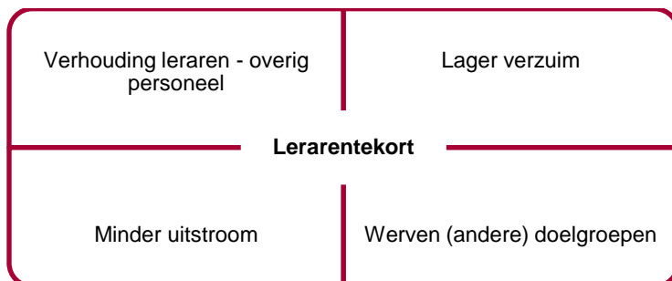
Figuur 2. Scenario's anders organiseren – lerarentekort

Hoewel het bestrijden van het (dreigende) lerarentekort op scholen geen primair doel is van anders organiseren, zijn op basis van de praktijkvoorbeelden wel verschillende scenario's mogelijk die landelijk invloed kunnen hebben op het lerarentekort. Deze scenario's worden schematisch weergegeven in figuur 2 en onder het figuur nader toegelicht. 3 Omdat de scenario's zijn gebaseerd op de praktijkvoorbeelden zullen er in de praktijk ook andere voorbeelden voorkomen, die op hun beurt mogelijk invloed kunnen hebben op het voorspelde lerarentekort. Ook zullen de beschreven voorbeelden in de praktijk niet overal dezelfde uitwerking hebben. Om deze variatie in een scenario te kunnen vatten, wordt bij de scenario's vaak uitgegaan van meerdere mogelijkheden.