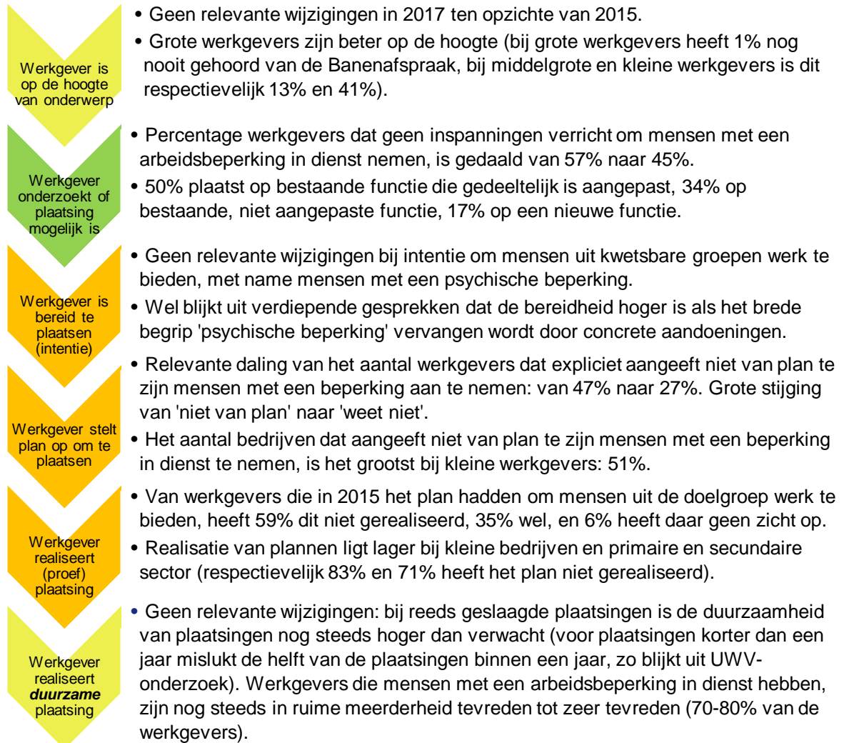
Figuur 2. Samenvatting uitkomsten tweede meting: ervaringen in 2017 ten opzichte van 2015 (legenda: groen gemarkeerde stappen tonen, beredeneerd vanuit de doelstelling van de Participatiewet en de Banenafpraak, een duidelijke verbetering, oranje duidt op een gemengd beeld en geel op weinig verandering).

Aangezien nieuwe aspecten van de Participatiewet en de Banenafpraak vooral het bieden van werk aan mensen met een arbeidsbeperking door reguliere werkgevers betreft, besteden we relatief veel aandacht aan dit onderwerp. Daarom is ook één van de twee hoofdvragen puur gericht op dit onderwerp. De andere hoofdvraag is algemeen van aard en betreft de ervaringen van werkgevers met werkgeversdienstverlening, gericht op alle doelgroepen van de Participatiewet, zowel de bestaande (voormalig WWB'ers) als nieuwe doelgroepen.