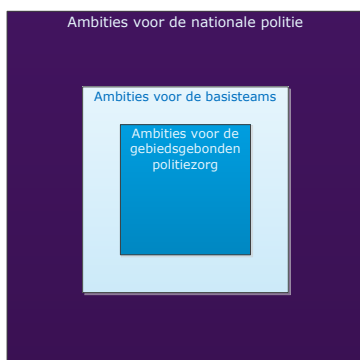
Afbeelding 2: Ambities

In de basisteams heeft de politie een groot deel van haar taken belegd. De Inspectie heeft hieruit de kernopgave van de basisteams geselecteerd: de gebiedsgebonden politiezorg (GGP). Het onderzoek richt zich derhalve in de eerste plaats op de vraag in hoeverre de politie er in slaagt om haar ambities voor GGP te realiseren (zie afbeelding 2). In paragraaf 1.3 wordt nader ingegaan op de leidende principes van GGP.