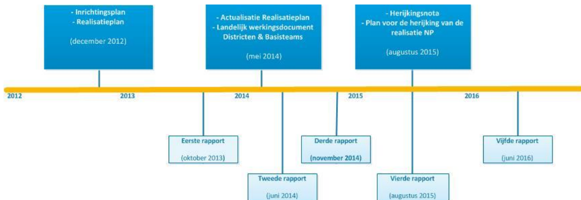
Afbeelding 1. Tijdslijn planvorming reorganisatie politie en rapporten Inspectie