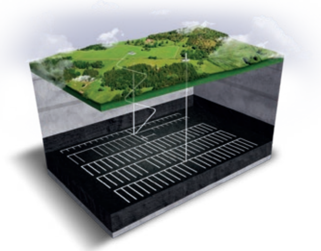
Figuur 2: Een artistieke impressie van een mogelijke eindberging voor Nederlands radioactief afval in een diepliggende geologische formatie.

maatschappelijke aspecten en de besluitvorming over de eindberging van radioactief afval. De dimensie tijd komt in al deze hoofdonderdelen terug. Het advies eindigt met conclusies en aanbevelingen.