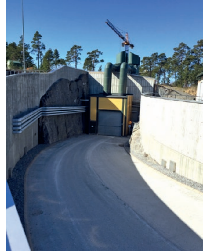
Figuur 3: Toegang tot de Finse eindbergingsfaciliteit Onkalo 19

Het ligt voor Nederland om diverse redenen voor de hand de