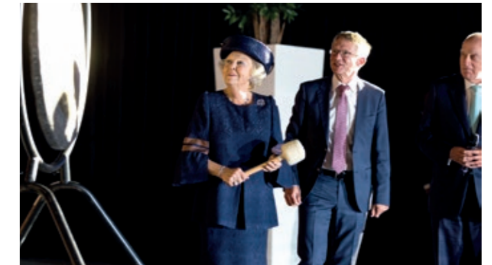
Figuur 5: HKH Prinses Beatrix opent met een gongslag het opslaggebouw voor verarmd uranium (VOG-2) op 13 september 2017.

Tenslotte is de vraag: wat leeft er werkelijk onder de mensen? Soms lijkt het dat lokale en regionale bestuurders de mening van de burgers afschermen. Om dit af te doen met zo werkt onze democratie' is niet meer van deze tijd, waarin politiek en burgers verder dan ooit van elkaar af lijken te staan. Zoals ook in dit advies bepleit moet de beslissing over eindberging voorafgegaan worden