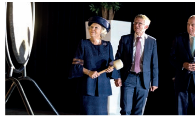
KH Prinses Beatrix opent met een gongslag het opslaggebouw voor verarmd uranium (VOG-2) op 13 september 2017.

Volgens de Adviesgroep is het belangrijk om in gesprek te gaan over de onzekerheden die er zijn over een eindberging. Die geven ruimte voor een dialoog over de oplossingen. Dit geldt vooral voor de zogenaamde 'safety-case', het model waarmee wordt aangegevoerd wat de risico's zijn voor een oplossing van een eindberging en waarmee onzekerheden worden geïdentificeerd.