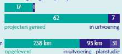
Figuur 1 Samenvatting stand van het HWBP-2, peildatum 31 december 2017