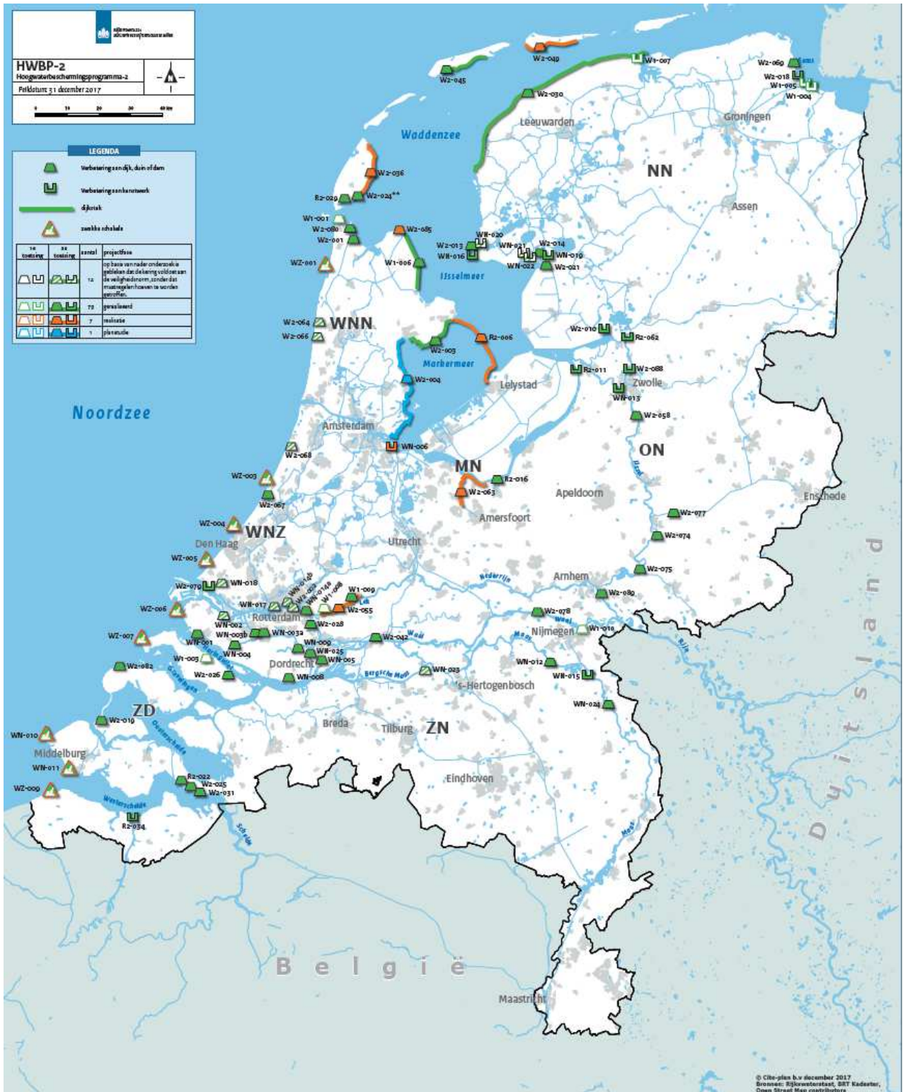
Figuur 2 Actuele scope van het programma, peildatum 31 december 2017