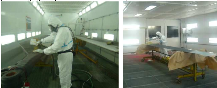
Figuur 2. Schuurwerkzaamheden in voorbereidings-/spuitcabine met geïntegreerde puntafzuiging en spuitwerkzaamheden in spuitcabine

Spuiten/vernevelen van chroom-6 houdende verf vindt alleen plaats in de spuitcabines van DHC (locatie Gilze-Rijen), VKL en LCW. Spuiten van chroom-6 houdende verven duurt meestal 10-15 minuten per dag. De schilder spuit alleen delen en/of onderdelen van de vliegtuigen en helikopters. Het geheel spuiten van helikopters/vliegtuigen is door het CLSK uitbesteed. De schilder gebruikt tijdens het spuiten onafhankelijke adembescherming 20 en beschermende kleding/handschoenen. Machinale bewerkingen vinden voornamelijk plaats in speciale voorbereidingsruimten met ruimteafzuiging en puntafzuiging. De schilder gebruikt daarbij adembescherming en beschermende kleding/handschoenen. Verf aanbrengen met de kwast, roller of stift vindt plaats in de spuitcabines en bij spotreparaties op het vliegtuig/helikopter in de hangaars. De schilder gebruikt daarbij adembescherming en beschermende kleding/handschoenen.