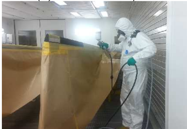
Figuur 3: spuitwerkzaamheden met weinig mogelijkheden om spuitnevel te ontwijken door (te)veel werkstukken in spuitcabine

Als laatste zijn organisatorische maatregelen nodig om de luchtconcentratie te beheersen. Luchtconcentraties boven de grenswaarden ontstaan, indien schilders onvoldoende de spuitnevel ontwijken – of daartoe in staat zijn. Het technisch inrichten van een spuitcabine heeft alleen meerwaarde, als tevens gebruiksvoorwaarden worden vastgesteld, waarmee wordt geborgd dat de schilders de spuitcabine ook zo (kunnen) gebruiken, dat geen contact plaatsvindt met de spuitnevel. Het juist opstellen van werkstukken en realiseren van voldoende bewegingsruimte (maximaal aantal werkstukken) zijn daarvan voorbeelden. In de werkplanning moet dan ook rekening gehouden worden met voldoende tijd om dit soort maatregelen te kunnen uitvoeren. Met het verlagen van de grenswaarde in 2017 is het belang van deze gebruiksvoorwaarden in spuitcabines sterk toegenomen. Het CLSK en CEAG voeren inmiddels een onderzoek uit naar 'best practices' in spuitcabines. Dit punt is opgenomen in het 'Plan van aanpak verlaging grenswaarde chroom-6'.