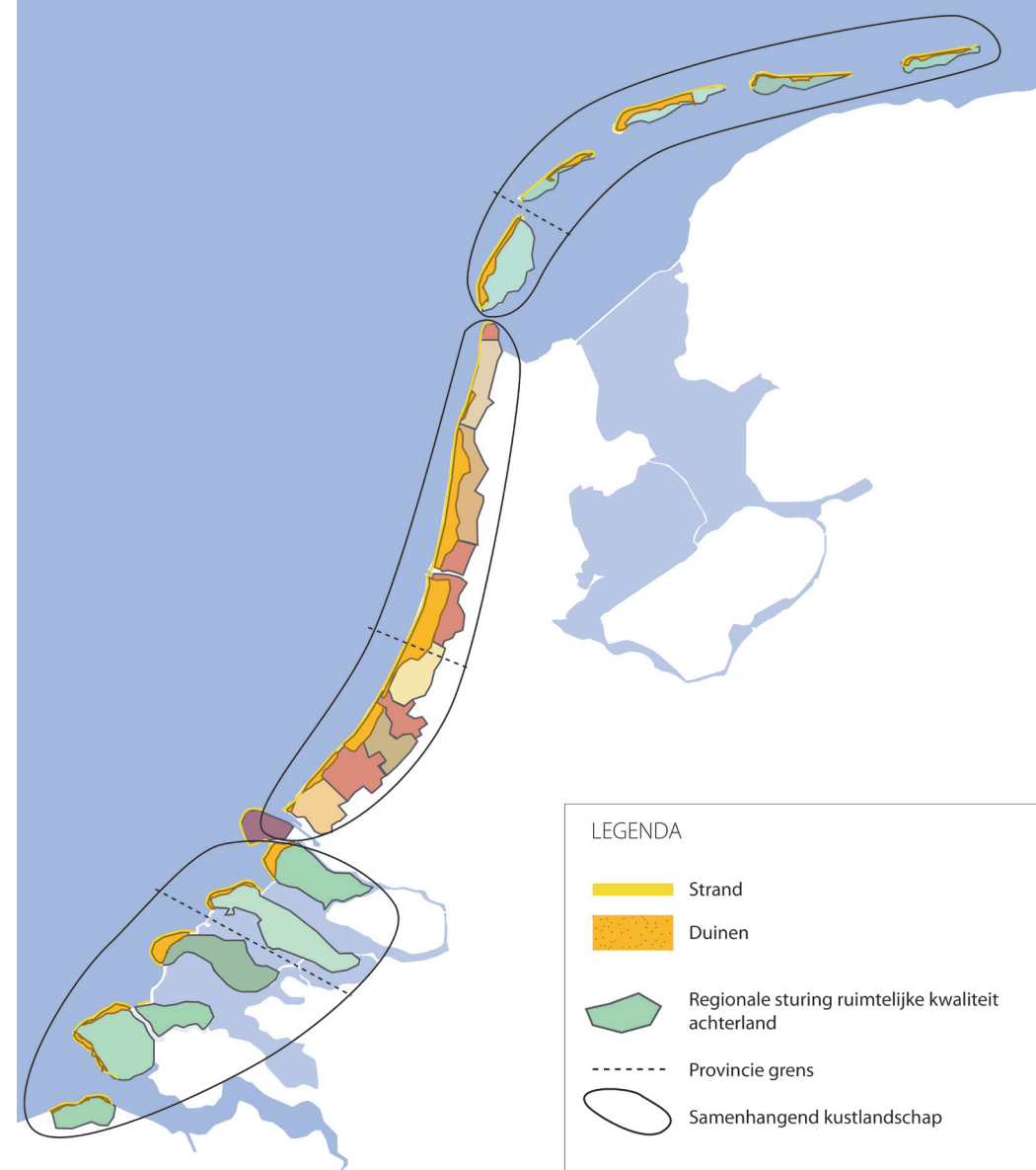
Figuur 2 Achter de duinen