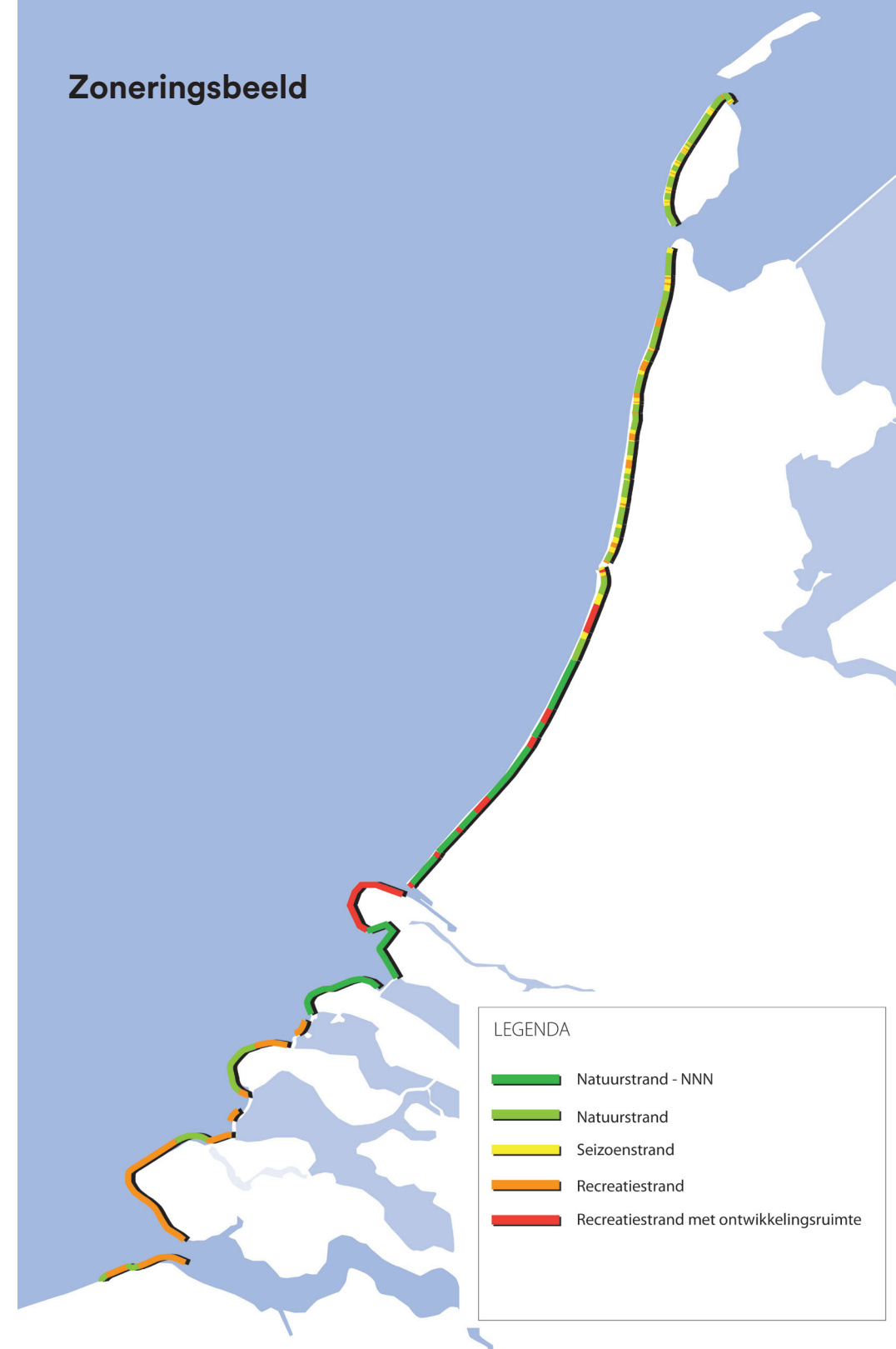
Figuur 1 Zoneringsbeeld