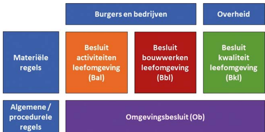
Figuur 1.1: De indeling van de AMvB's

De indeling van de AMvB's naar doelgroepen en type regels is gevisualiseerd in figuur 1.1.