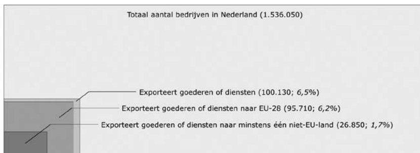
Figuur 1: Verhouding tussen het totaal aantal bedrijven in Nederland en het exporteerende deel ervan (2016) 1 .

1 Hierbij kan men in acht nemen dat de zmkp-populatie 98,8% van de totale bedrijvenpopulatie behelst. Zzp'ers maken deel uit van beide populaties. Bij berekeningen zijn standoijfers per 1 januari (totaal aantal bedrijven) gecombineerd met jaarcijfers voor exporteerende ondernemingen. Dit leidt tot een (beperkte) bias.