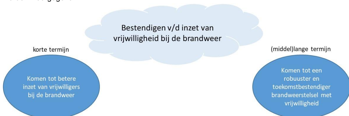
Figuur 1: Ambitie en doelen Programma Vrijwilligheid

Op basis van het voorgaande kan de ambitie van het programma vrijwilligheid schematisch als volgt worden weergegeven.