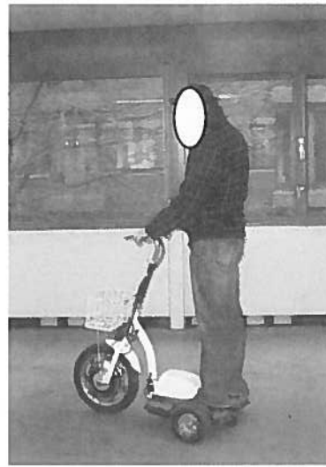
Afbeelding 1. De Zappy3

Wanneer het stuur naar links wordt gedraaid, zal het voertuig naar links gaan en vice versa. De gashandel zit aan de rechterzijde op het stuur en wordt met de duim bediend. Aan de linkerkant van het stuur zit een remhendel die het remmechanisme in het voorwiel bedient. De Zappy3 heeft een lamp aan de voorkant van het voertuig die met een schakelaar aan de linkerkant van het stuur aan- en uitgezet kan worden. Er is geen lamp aan de achterzijde van het voertuig aanwezig. Ten slotte beschikt de Zappy3 nog over een claxon welke eveneens met een schakelaar aan de linkerkant van het stuur bedient kan worden.