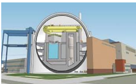
Figuur 2.

In de vroege ochtend van 16 april is om 06.15 uur een gasfles geëxplodeerd in het splijtstofopslagbassin (SOB) bij