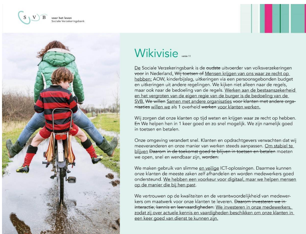
Afbeelding: de SVB-Wikivisie op het intranet van de SVB

De SVB schrijft samen met de hele organisatie aan haar toekomstvisie. Dit doen we door een Wikivisie die permanent open staat voor aanscherpingen en aanvullingen. De Wikivisie vormt het uitgangspunt voor de ambitie en strategische doelstellingen van de SVB; kortom wat wij willen bereiken in de toekomst.