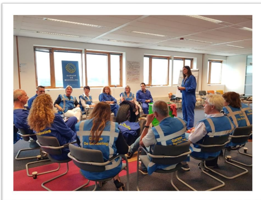
Afbeelding: SVB-medewerkers bijeen in Garage de Bedoeling

Om te werken vanuit de bedoeling heeft de SVB verschillende initiatieven zoals 'Garage de Bedoeling'. Dat is een aanpak waar medewerkers vanuit verschillende disciplines, veelal samen met andere organisaties zoals het ministerie van SZW, de Belastingdienst, het Nibud, het ministerie van VWS en PGB-budgetverstrekkers vanuit de bedoeling dilemma's rond onwenselijke situaties voor burgers oplossen. We gebruiken dit als input voor onze eigen beleidsregels en nieuwe regelgevingstrajecten. In 2019 continueren we deze werkwijze. Wanneer er spanning zit tussen de letter van de wet en de bedoeling van die wet zullen wij dat signaleren bij onze opdrachtgevers, de ministeries van SZW en VWS. Een ander voorbeeld voor het werken vanuit de bedoeling is de Werkplaats Problematisch Schulden.