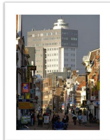
Afbeeldingen: SVB-locaties in Deventer en Leiden

De huisvestingstrategie gaat uit van het hebben van passende ruimte van waaruit de SVB haar werk doet. Het eigenaarschap van panden is geen kerntaak van de SVB en laten we daarom, en mede gezien de hierboven beschreven ontwikkelingen, los. We bekijken stap voor stap en in nauw overleg met onze eigenaar, per locatie en regio de passende huisvesting. Dat kan betekenen dat we een locatie voorlopig nog in bezit houden en overmaat verhuren. Het kan ook betekenen dat we gaan verkopen en de ruimte die we nodig hebben terug huren of elders passende ruimte huren, omdat we in de regio's actief willen blijven. De huisvestingstrategie moet mee ontwikkelen met en passen bij de vorm van dienstverlening van de SVB. Met de huisvestingsstrategie, in combinatie met ontwikkelingen als plaats- en tijdonafhankelijk werken, worden we minder afhankelijk van panden in eigendom en kunnen we onze dienstverlening aan de burger op een meer flexibele manier vormgeven.