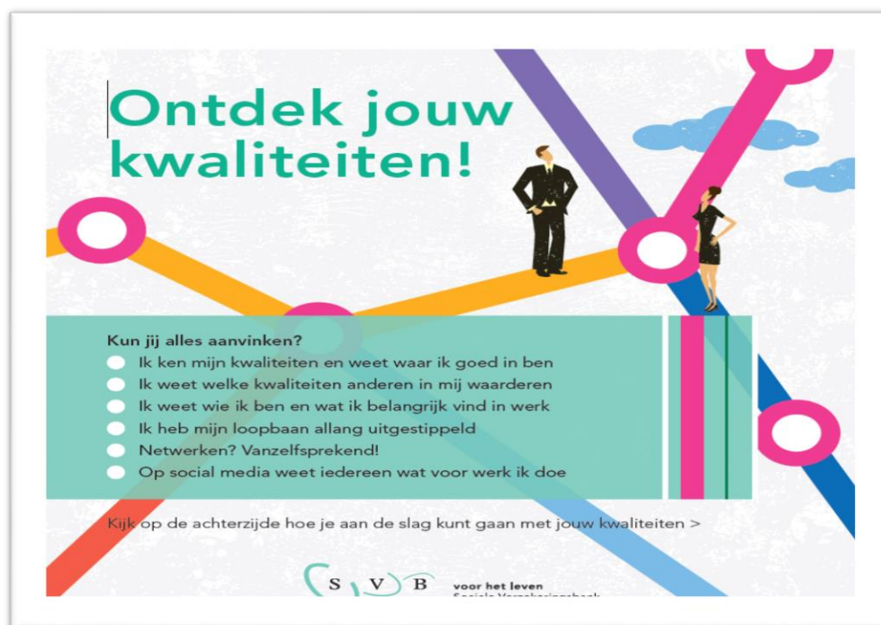
Afbeelding: interne SVB-campagne mobiliteit en vakontwikkeling

Wij bieden onze medewerkers een gerichte ontwikkelings- en mobiliteitsaanpak met focus op vakmanschap. De wenselijke gedrags- en cultuuraspecten versterken we om de SVB toekomstbestendig te maken.