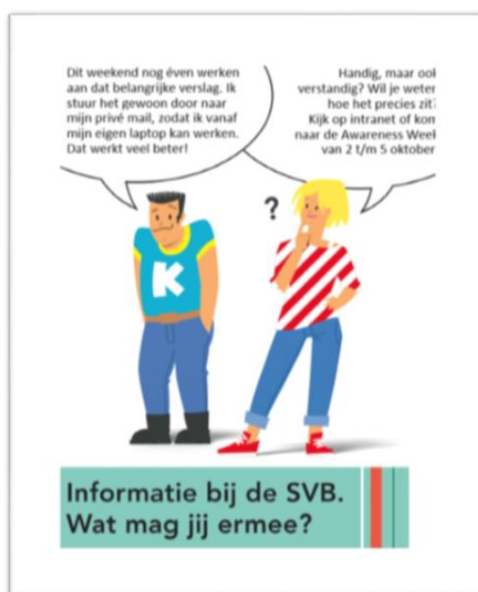
Afbeelding: interne SVB -bewustwording campagne

Het blijft mensenwerk. Daarom werken we met interne bewustwording programma's en investeren we ook in 2019 in opleidingsprogramma's voor alle SVB-medewerkers en leiden we eigen specialisten op het gebied van informatiebeveiliging, privacy en business continuity op.