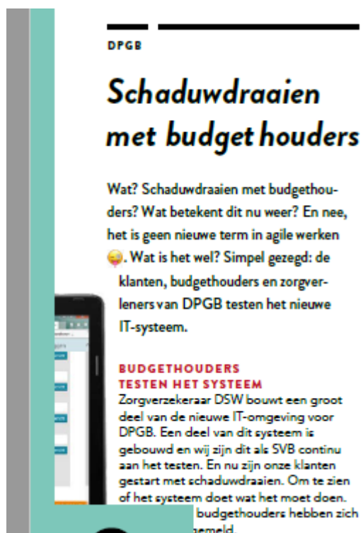
Afbeelding: aandacht in personeelskrant SVB de bedoeling voor het nieuwe PGB-IT-systeem

De SVB speelt een voorname rol in de uitvoering van het persoonsgebonden budget (PGB). Vanuit de kennis en ervaring die bij de uitvoering van het PGB is opgebouwd en verworven, adviseren we bij de beleidsontwikkeling van het PGB. Die bijdrage is onder andere zichtbaar bij de uitvoering van de pilot Integraal PGB. Vanaf 1 januari 2019 start er een verbreding en opschaling van de pilot integraal PGB. Hiervoor wordt een AMvB opgesteld. Budgethouders van deelnemende gemeenten kunnen meedoen aan het Integrale PGB. Voor hen betekent dit dat zij uiteindelijk minder tijd kwijt zijn aan de administratie rondom hun PGB's en hun budget meer vanuit de zorgbehoefte kunnen besteden. Daarnaast werkt de SVB mee aan de actieagenda PGB, die onder leiding van het ministerie van VWS met de keten wordt opgesteld om het PGB meer toekomstbestendig te maken. Denk hierbij aan onderwerpen als: reduceren complexiteit en administratieve lasten, PGB -vaardigheid en -verantwoordelijkheid, voorlichting en toerusting budgethouders en verstrekkers en fraude. De implementatie hiervan vindt in 2019 plaats. De wijzigingen in de Wet minimumloon zullen in 2019 eveneens worden geïmplementeerd.