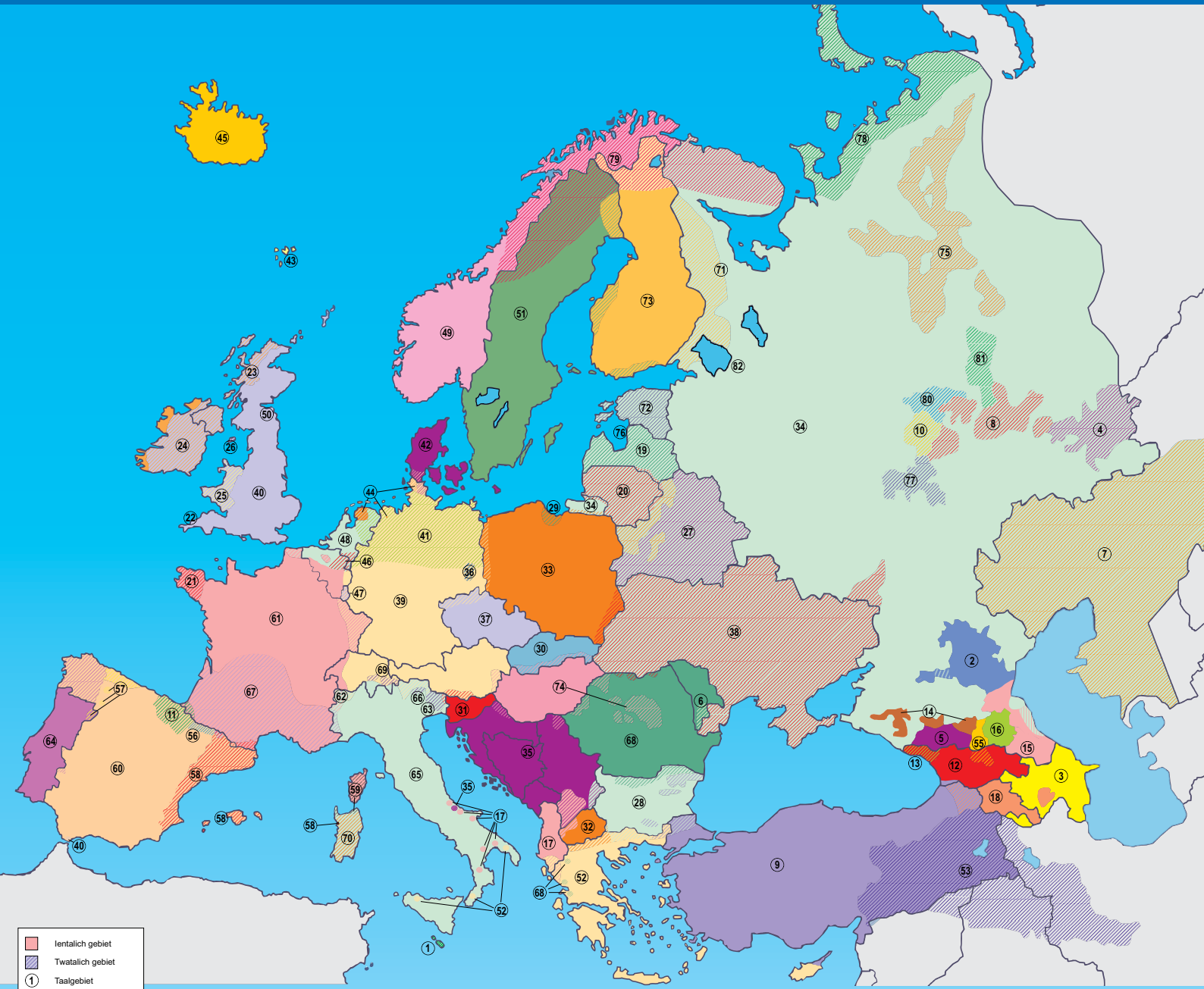
It Jiddysk (45A) en it Romany (54) binne talen sûnder territoarium