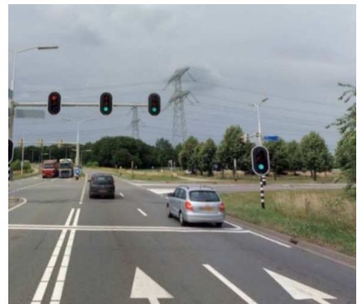
Figuur links kruispunt aansluiting A73, rechts kruispunt het Vonderen/Rijksweg.