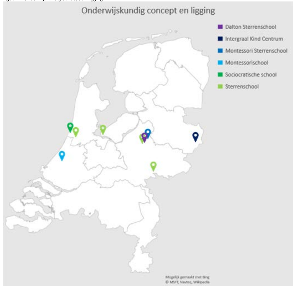
Figuur 2. Onderwijskundig concept en ligging