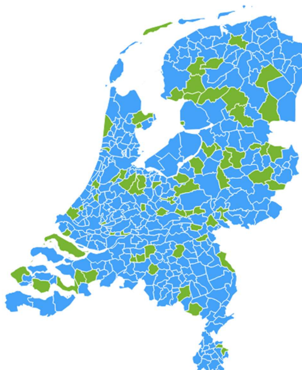
Figuur 1. Deelnemende gemeenten aan de schriftelijke enquête en de interviews.

62 ambtenaren gaven aan voor welke gemeente zij werkzaam zijn. De deelnemende gemeenten zijn goed gespreid over de verschillende regio's (Noord, Midden, Zuid, Oost en West).