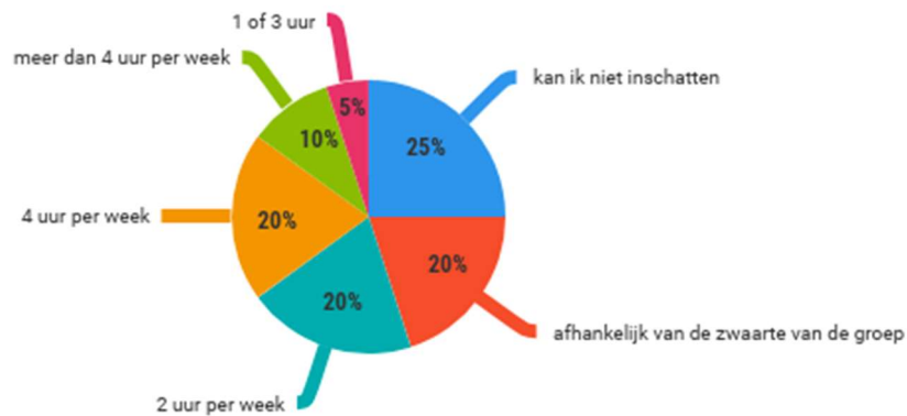
Figuur 2. Antwoord op de vraag: "Hoeveel uur moet een ve-groep gemiddeld volgens u ondersteund worden door een hbo'er, wil dit effectief zijn?"

Vervolgens hebben we de respondenten gevraagd of de uitvoerbaarheid van de functie van de hbo'er, zoals zij deze voor ogen hebben, haalbaar is in twee uur per week per groep. Hierop reageert bijna zestig procent met 'weet ik niet'. Een vijfde gaat ervan uit dat dit voldoende is, waarbij de belangrijkste reden die genoemd wordt de aanwezigheid van de IKK-coach is. Een vijfde vindt twee uur te weinig, omdat men vreest dat de hbo'er dan niet genoeg verbinding met de groep en pm'ers kan leggen en omdat het takenpakket er te groot voor is. Een geïnterviewde ambtenaar: "Twee uur per week is wel erg weinig, wil je als coach echt observeren en dat ook weer terugkoppelen. Ik heb organisaties met maar één of twee vve-groepen. Twee uur per week hbo-inzet, wat levert dat op? Bovendien zie ik het gevaar in kleine organisaties dat dit soort uurtjes opgaan aan management en andere organisatiedingen."