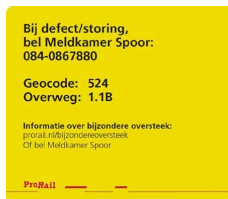
Figuur 4. Voorbeeld van sticker om overweggebruikers te informeren over een bijzondere oversteek

De inspectie verwacht ook van ProRail dat zij actiever gaat monitoren op bijzondere oversteken. De behandelde aanvragen voor een Bijzondere oversteek geven nog niet het beeld dat alle, vooral bijzondere wegtransporten, de procedure kennen. In het verleden deden zich meerdere ernstige incidenten voor met bijzondere wegtransporten. De inspectie verwacht dat deze transporten meerdere keren per jaar plaatsvinden. Daarbij zouden de overweggebruikers de procedure zeker moeten volgen. De inspectie denkt dat overweggebruikers dat niet altijd doen vanwege de minimale aanvraagperiode van 48 uur.