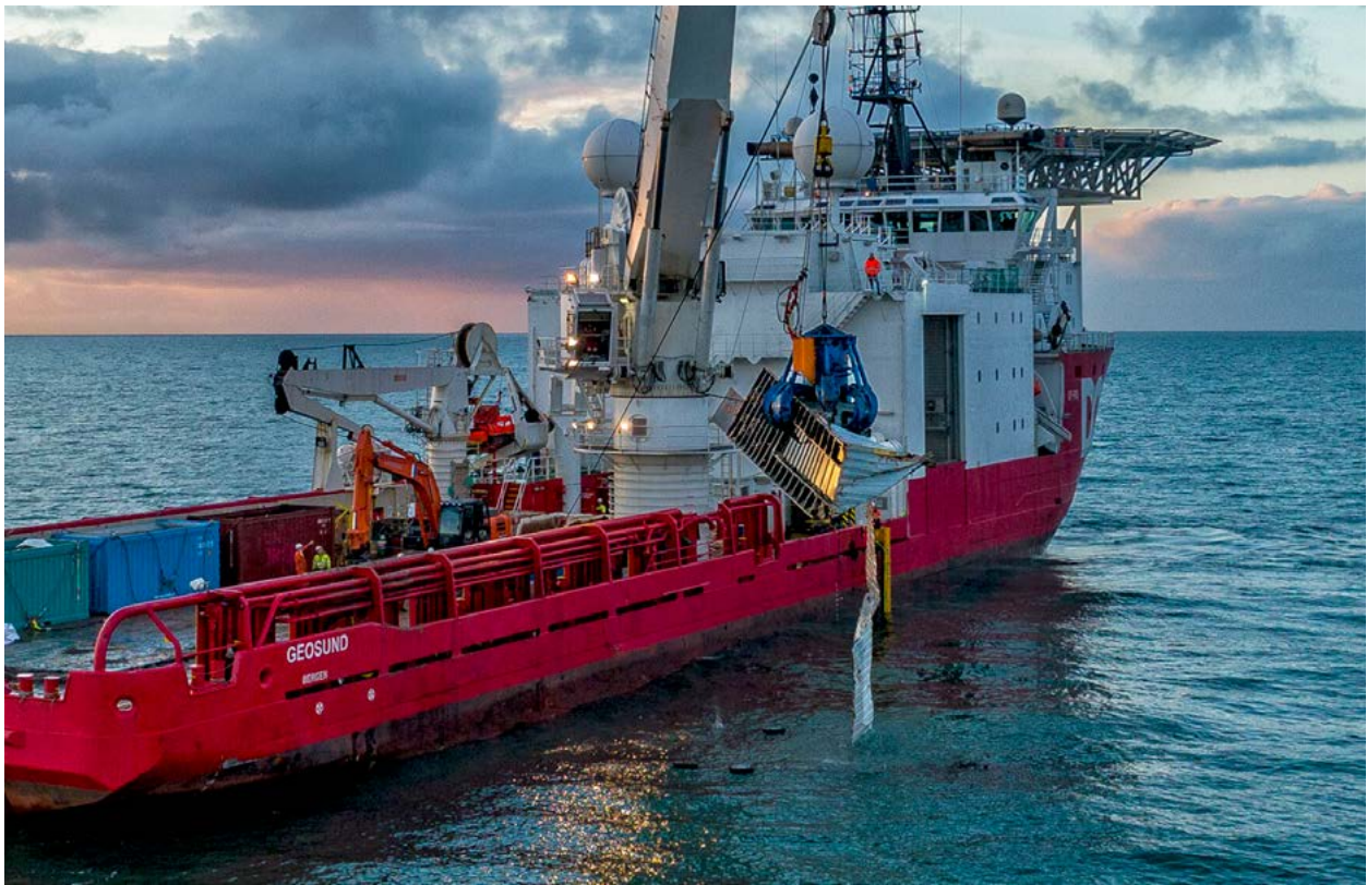
| Berging van een beschadigde container uit de Noordzeekustzone verloren door de MSC Zoe 46 .