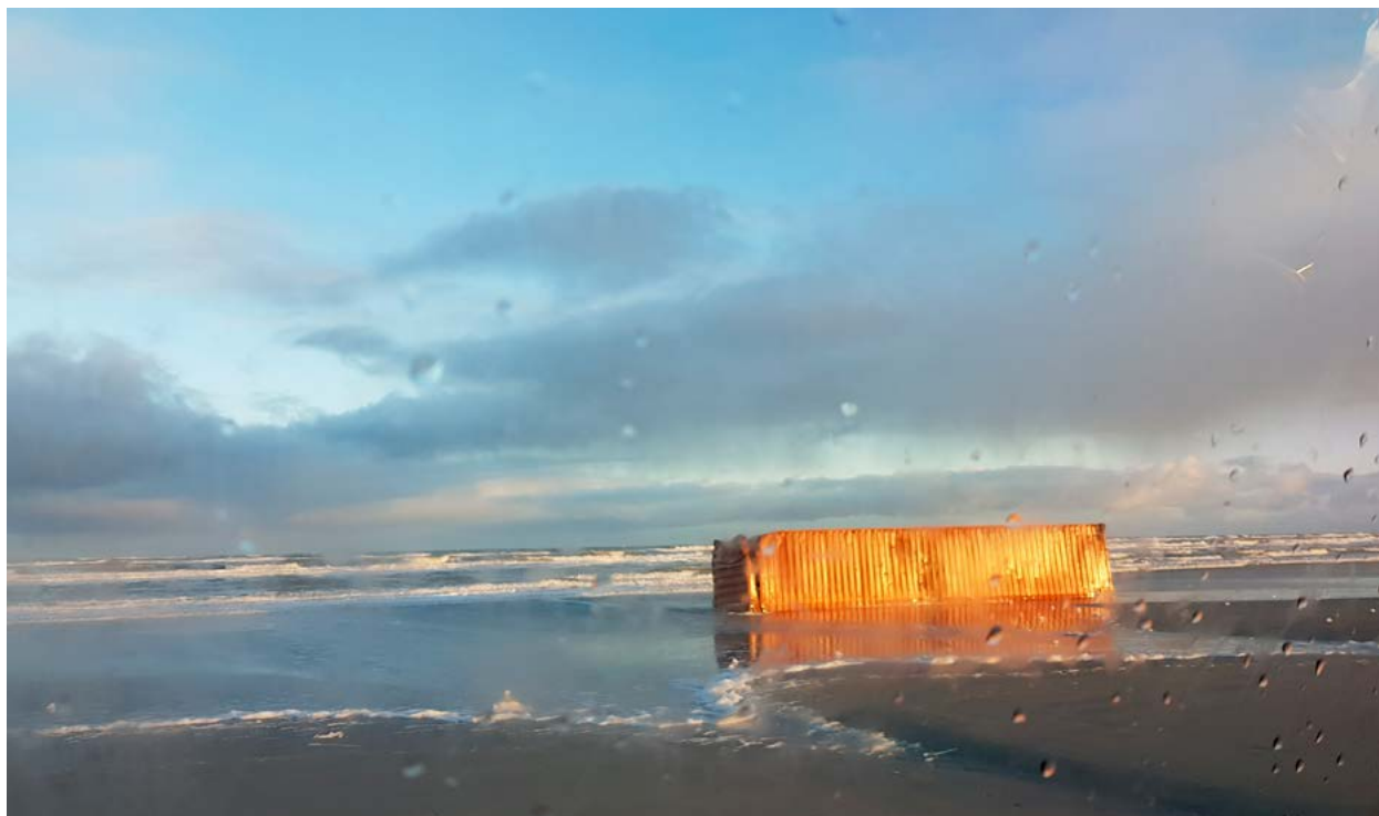
Door MSC Zoe verloren container, aangespoeld op het strand van Ameland 2 .

Het jaar 2019 was nog maar net begonnen toen de MSC Zoe een deel van haar deklading verloor net ten noorden van het Werelderfgoed Waddenzee. Al snel stroomden berichten binnen over mogelijk gevaarlijke stoffen en verschenen er foto's van stranden bezaaid met allerlei (vooral kunststof) voorwerpen zoals stoelen, jassen en speelgoed. Er werd vrij snel gestart met het opruimen en afvoeren van aangespoelde containers en losse lading en, zodra het weer het toeliet, met een inventarisatie van de containers op de zeebodem. De stranden lijken op het eerste gezicht inmiddels schoon, maar nog niet alle inhoud van de containers is geborgen. Het opruimen van de containers van de zeebodem in opdracht van de rederij kan nog enige tijd duren 3 . Met als risico dat hun lading alsnog