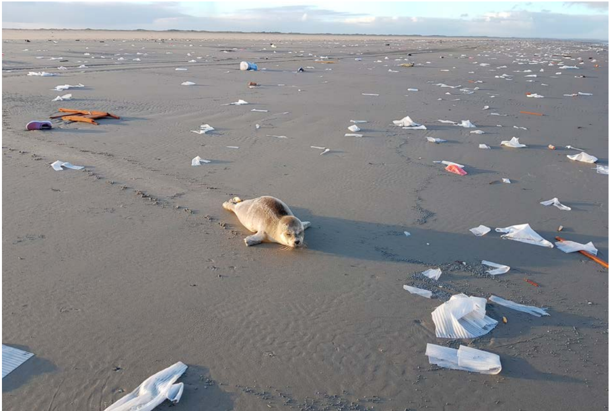
Jonge zeehond te midden van aangespoelde lading van de MSC Zoe op het strand van Balg (aan de oostkant van Schiermonnikoog) op 5 januari 2019 70 .

consortia. Elk consortium kan bestaan uit natuur- en sociale wetenschappers. Hoofdaanvragers zijn ervaren onderzoekers in dienst bij een Nederlandse universiteit en/of onderzoeksinstelling voor ten minste de looptijd van het project. Samenwerking met Duitse (eventueel Deense) partners, maar ook met vooraanstaande onderzoekers elders in de wereld, is daarbij een pré.