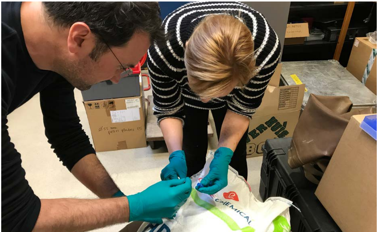
| Bemonstering van HDPE-pellets afkomstig van Schiermonnikoog op het Koninklijk NIOZ op Texel 60 .

Onderzoeksvragen hierbij zijn onder meer: