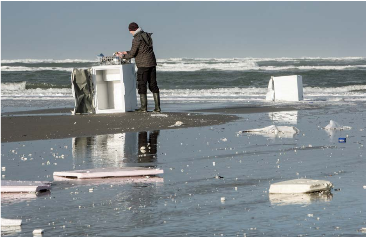
| Piepschuim verpakkingsmateriaal van koelkasten op het strand van Ameland dat al in kleinere deeltjes uiteenvalt 54 .