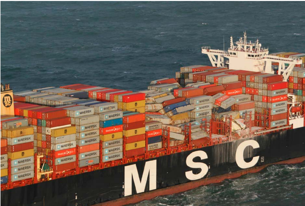
| Containers op de MSC Zoe 1 .