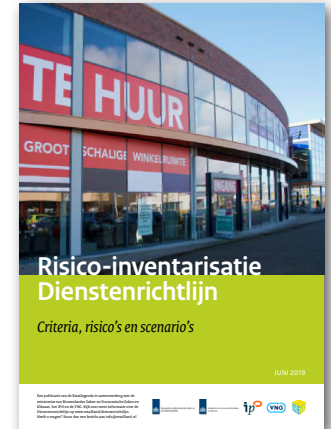
Publicatie Risico-inventarisatie Dienstenrichtlijn

UNIFORME KOOPSTROMEN. Provincies werken samen aan het uniform meten van koopstromen. Het doel van dit afsprakenkader is om betrouwbare en vergelijkbare koopstroomgegevens per provincie te verzamelen, zodat deze op landelijk niveau met elkaar kunnen worden vergeleken.