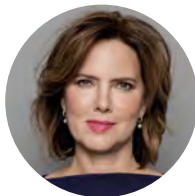
Cora van Nieuwenhuizen Minister van Infrastructuur en Waterstaat

Al met al zal er dus het nodige moeten gebeuren om onze uitstekende uitgangspositie in de logistiek te behouden en verder uit te bouwen. De ambities en doelstellingen die in dit document staan verwoord, zijn dan ook stevig. Maar alleen wanneer de lat ook daadwerkelijk hoog ligt, kan uiteindelijk gesproken worden over topprestaties. En als er iets is waar we het met zijn allen over eens zijn, dan is het dat we topprestaties willen blijven leveren en ook over enkele decennia nog een economisch gezond en in internationaal opzicht excellerend logistiek systeem willen hebben, dat tegelijkertijd een bijdrage levert aan welzijn en leefbaarheid.