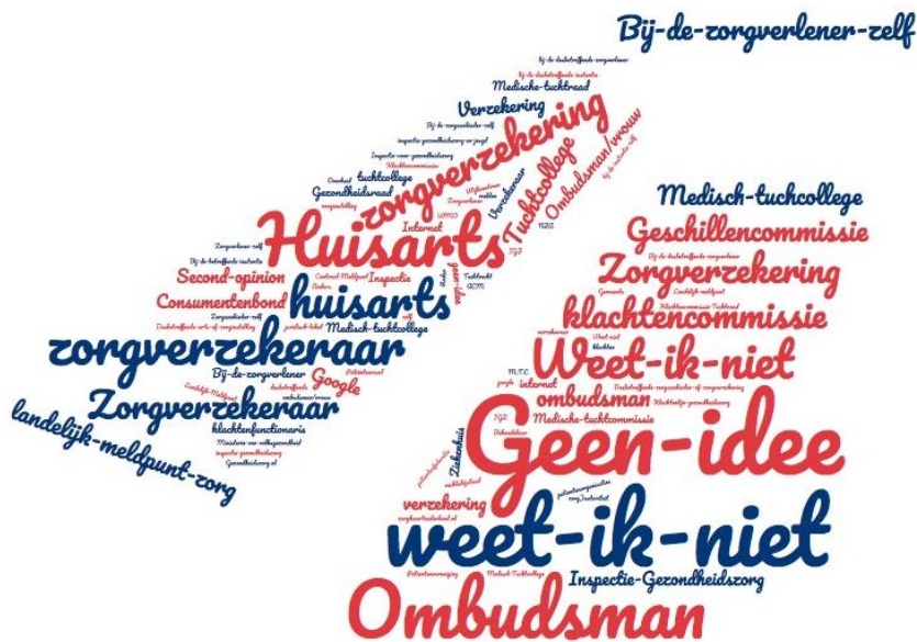
Figuur 3 Waar zou u terecht kunnen met een klacht over de gezondheidszorg?

Alle respondenten werden allereerst open bevraagd naar hun ideeën over bij wie zij terecht zouden kunnen met een klacht over de gezondheidszorg. Deze antwoorden staan weergegeven in figuur 3. Vervolgens werd deze vraag nogmaals gesteld, maar dan met verschillende antwoordcategorieën (tabel 28). Hoewel het antwoord ‘bij de zorgverlener zelf’ in beide gevallen veelvuldig voorkomt, is het bij de open bevraging (figuur 1) opvallend dat een groot deel van de respondenten aangeeft het niet te weten (antwoordcategorieën “geen idee” en “weet ik niet”).