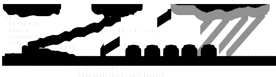
Figuur Verspreiding van ammoniak in de atmosfeer

De mate van verspreiding van ammoniak is afhankelijk van het type bron en de atmosferische omstandigheden. Ammoniak dat vrijkomt van de mest die wordt uitgereden op het land verspreidt veel minder snel in de menglaag dan het ammoniak dat uit mechanisch geventileerde stallen wordt uitgestoten, omdat deze op grotere hoogte in de lucht wordt gebracht. Dit is de reden waarom na de grote smog-ramp in 1952 in Londen, waarbij vele mensen het leven lieten, de hoge-schoorstenen-politiek is ingevoerd: hoe hoger de schoorsteen, des te groter de verspreiding en verdunning van het gas. De gassen kwamen daardoor niet meer in hoge concentraties in de steden voor, maar het gevolg was wel dat er zich elders, in dit geval in Scandinavië, langzamerhand verzuringsproblemen gingen voordoen.