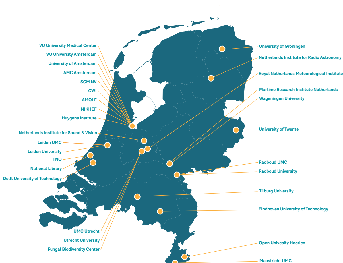
Figure: Map of projects 2014-2018

Bron: Self-assessment eScience Center 2014 – mid 2018