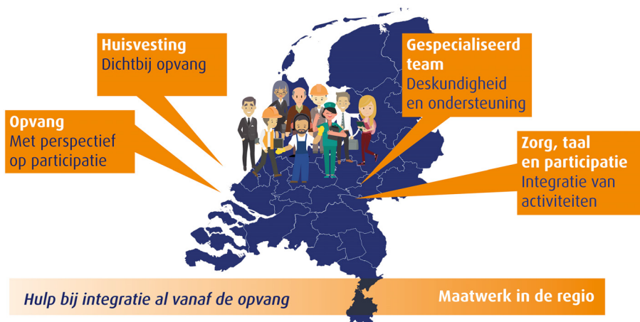
Figuur 2.1 Opvang, huisvesting en ondersteuning van statushouders in één regio

Breed gedragen is de gedachte dat voor een succesvolle toeleiding naar participatie een infrastructuur van nabij gelegen en onderling samenwerkende partijen van vitaal belang is. Idealiter moeten opvang, huisvesting en participatie binnen dezelfde (arbeidsmarkt)regio plaatsvinden. Op deze manier ontstaat de mogelijkheid voor maatwerktrajecten en voor afstemming en samenwerking. De ondersteuning van statushouders begint dan bij opvang in de regio waar kansen liggen. Vervolgens gaat het om uitplaatsing naar gemeenten met mogelijkheden voor duurzame participatie. Het bundelen van deskundigheid en zorgen voor goede afstemming moeten belangrijke onderdelen zijn van het werk van professionele teams binnen de gemeente die de statushouders (en andere nieuwkomers) ondersteunen. Deze deskundigheid moet uiteindelijk uitmonden in een aanbod van integrale trajecten, waarvan zowel taal als participatie deel uitmaken (zie ook figuur 2.1). Overigens moet hierbij bedacht worden dat al veel gemeenten mee zijn begonnen met een dergelijke aanpak. 19