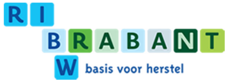
Cliëntenraad RIBW Brabant

Dit initiatief wordt mede ondersteund door: