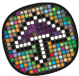
Cliëntenraad Stichting Anton Constandse