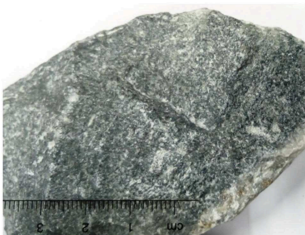
Figuur 1: Bestone ®