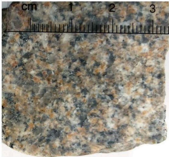
Figuur 3: Graniet (Glensanda)