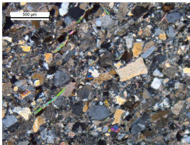
Figuur 2: Microscopische weergave van de Bestone ®

Het gesteente dat als Bestone ® (Figuur 1) verhandeld wordt is een gesteente dat oorspronkelijk (in het Devoon, circa 385 miljoen jaren geleden) in een zeebekken in Noorwegen is afgezet. Rivieren vervoerden erosiemateriaal naar dit zeebekken. Het aangevoerde erosiemateriaal bestond naast hoekige kwarts- en veldspaatkorrels ook uit korrels gesteentefragmenten die op hun beurt weer uit kwarts en veldspaten bestaan. Bij de afzetting hiervan werd tussen de korrels klei 'gevangen'. Dit losse sediment werd in de loop der tijden gecementeerd door calciet ('kalk'). Mogelijk ontstond in deze tijd ook het mineraal chloriet. Er ontstond een stevig gesteente met als voornaamste componenten kwarts, veldspaten (zowel alkaliveldspaten als plagioklaas), klei en calciet. Hiermee was de huidige Bestone ® nog niet aan het einde van zijn geschiedenis.