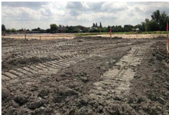
Figuur 5: Granuliet toegepast in een terreinophoging in Roelofarendsveen 2

Bij de verwerking van gesteenten komt fijn materiaal vrij. Hiervoor wordt eveneens de benaming 'granuliet' gebruikt. Onderstaande slaat op het fijne materiaal dat vrijkomt bij verwerking van gesteente. Figuur 5 laat een toepassing zien van granuliet 1 in een terreinophoging.