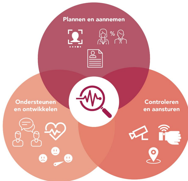
Figuur 1 Drie doelen van monitoringstechnologie