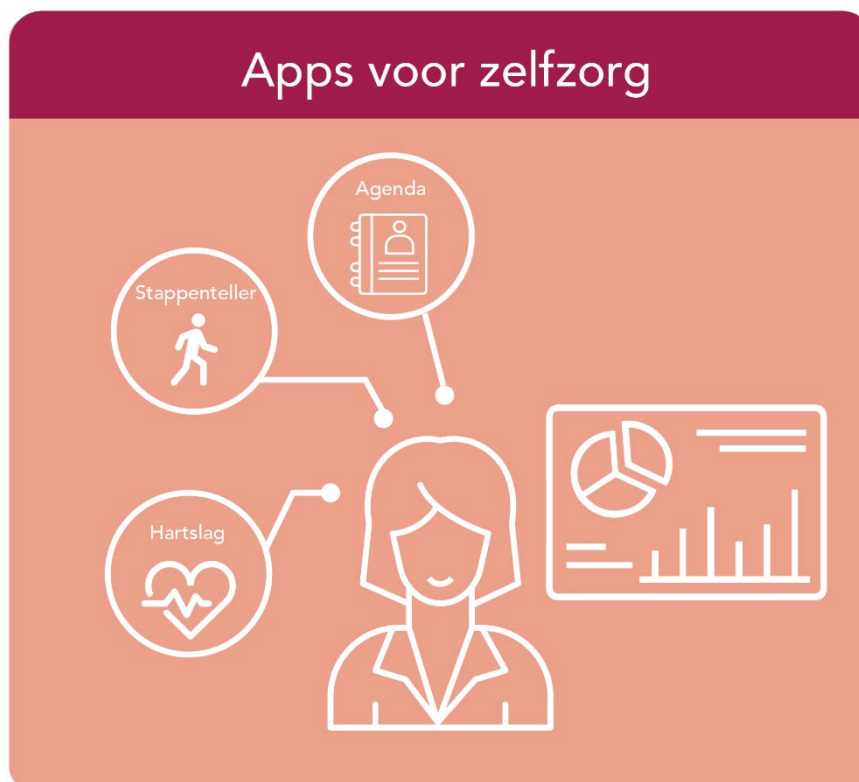
Figuur 6 Apps voor zelfzorg

De laatste jaren stijgt het aantal werkenden met stress- en burnoutklachten. In 2018 hadden bijna 1,3 miljoen Nederlandse werknemers 43 dit soort klachten (TNO, 2019). Daardoor stijgt de behoefte – zowel bij werkenden als bij organisaties – aan ondersteuning bij het verminderen van stress. 44 Er zijn dan ook inmiddels diverse instrumenten die individuen stimuleren tot een gezonde levensstijl en prettige werk-privé balans (Manohka, 2019; Adler-Bell en Miller, 2018), (zie figuur 6).