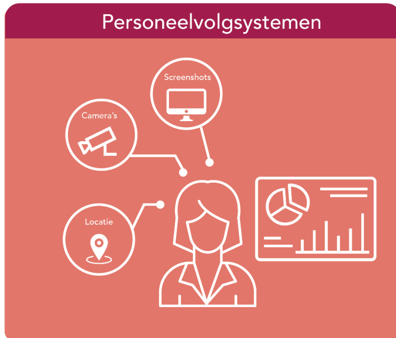
Figuur 4 Personeelvolgsystemen