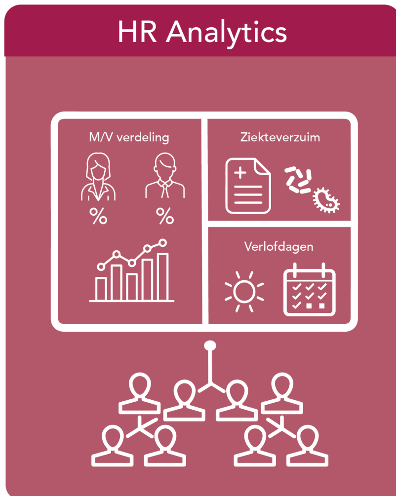
Figuur 2: HR-analytics