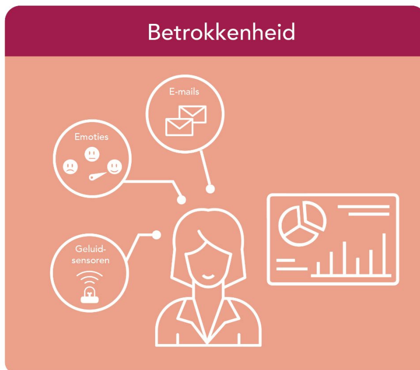
Figuur 7 Apps die betrokkenheid digitaal meten

“Er is nog veel traditioneel onderzoek, zoals een jaarlijks uitgebreid personeelstevredenheidsonderzoek. Er wordt ook gekeken naar andere soorten indicatoren, zoals emoties in e-mails of WhatsApp. Maar dat staat echt nog in de kinderschoenen. Je ziet bijvoorbeeld wel tussentrends: dingen als pulse-onderzoeken 50 .” Charissa Freese, Tilburg University