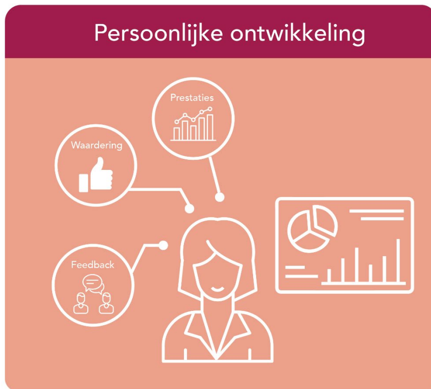
Figuur 8 Apps voor persoonlijke ontwikkeling