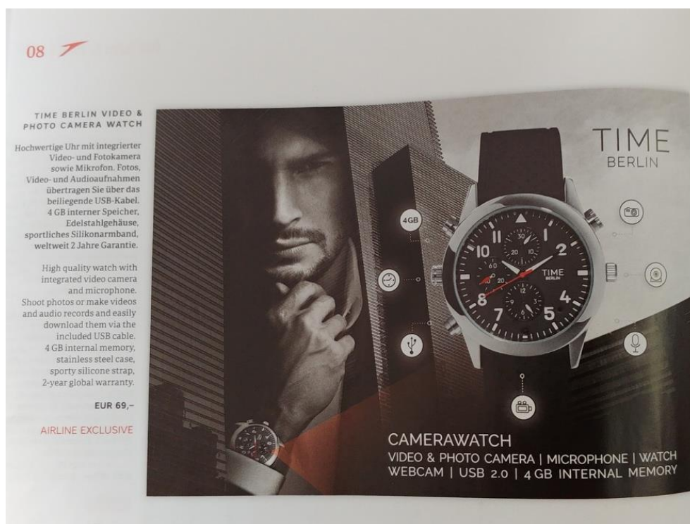
FIGUUR 3.1: 'TIME BERLIN' SMART WATCH MET INGEBOUWDE VIDEOCAMERA EN MICROFOON (ZOALS BESCHIKBAAR OP VLUCHTEN VAN AUSTRIAN AIRLINES)

Voor een product zoals de smartwatch is het dus lastig een scherpe scheidslijn te trekken. De classificatie in brede en enge zin zou dus in de toekomst kunnen worden aangevuld met een classificatie in termen van verminderde zichtbaarheid (bijvoorbeeld beginnend met drones, gevolgd door een smartphone, een smartwatch en tenslotte een typisch spionageproduct in de vorm van een pen of een knop). In deze verkenning hanteren wij, zoals gezegd, echter het onderscheid tussen spionageproducten in enge en brede zin, om te benadrukken dat hobbydrones ook als spionageproduct ingezet kunnen worden.