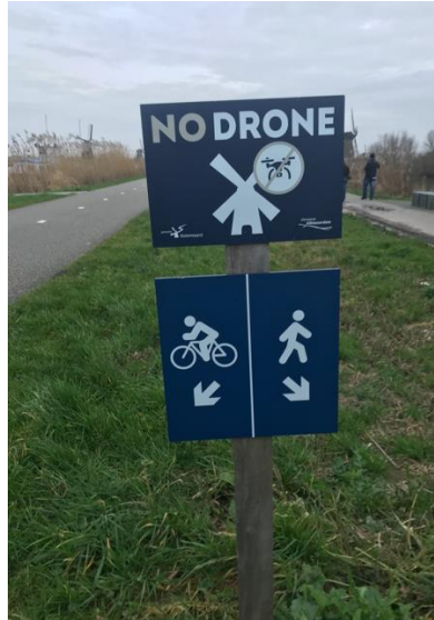
FIGUUR 6.1 WAARSCHUWINGSBORD KINDERDIJK

kunnen mensen ook op lokaal niveau worden gewaarschuwd, zoals bijvoorbeeld ten aanzien van dronegebruik in toeristische gebieden. Uit de focusgroepen blijkt bijvoorbeeld dat de bewoners van Kinderdijk van IJsselstein zelf maar een waarschuwingsbord hebben geplaatst om hinderlijke drones van toeristen tegen te gaan (zie Figuur 6.1).