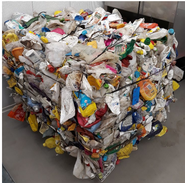
Figuur 2 Foto van het sorteerproduct: een PE sorteerbaal, output van een sorteerbedrijf

Figuur 2 toont ter illustratie een foto van het sorteerproduct (baal plastic als output van sorteerbedrijf) en figuur 3 toont een aantal foto's van gewassen maaggoed.