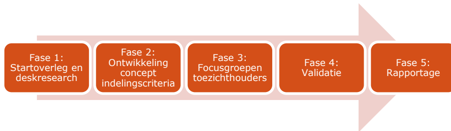
Figuur 3 Gefaseerde onderzoeksaanpak

In fase 1 van het onderzoek is na het startoverleg met de opdrachtgever deskresearch verricht naar broninformatie, zoals afkomstig uit jaarverslagen en jaarrekeningen van omroepen. Daarnaast is gekeken naar: