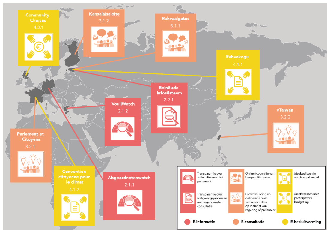
Figuur 1 Overzicht van de onderzochte digitale democratie-instrumenten

stil bij verschillende algemene voorwaarden die van belang zijn bij het succesvol invoeren van verschillende vormen van digitale burgerbetrokkenheid in Nederland.