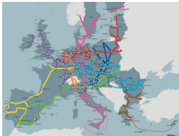
Figuur 4: TEN-T corridors. 45

De Europese Green Deal zoals de Europese Commissie deze in december 2019 presenteerde zet ook nadrukkelijk in op het stimuleren van modal shift naar water en spoor. Het Motorways of the Seas beleid van de EU draagt tot slot bij aan het versterken van de Europese kustvaart. Dit is positief voor de spilfunctie (hub and spoke) van de Nederlandse havens en bevordert duurzaam transport over zee door een lagere uitstoot per eenheid product in vergelijking met andere modaliteiten.