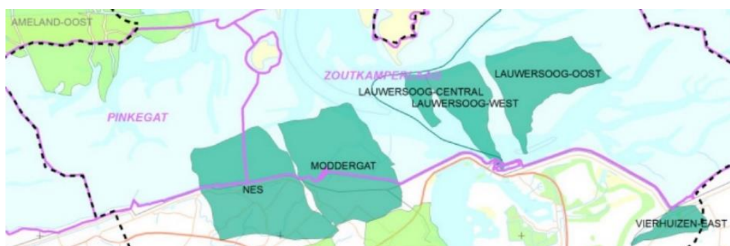
Figuur 1: Ligging gasvelden Nes, Moddergat, Lauwersoog C, Lauwersoog West, Lauwersoog Oost en Vierhuizen Oost (in donkergroen) binnen de kombergingsgebieden Pinkegat en Zoutkamperlaag (in paars).

De Nederlandse Aardolie Maatschappij BV (NAM) heeft van het Rijk toestemming om aardgas te winnen uit zes velden in het Waddenzeegebied: Moddergat, Nes, Lauwersoog C, Lauwersoog West, Lauwersoog Oost en Vierhuizen Oost (verder MLV-gasvelden). De winning is gestart in 2007.