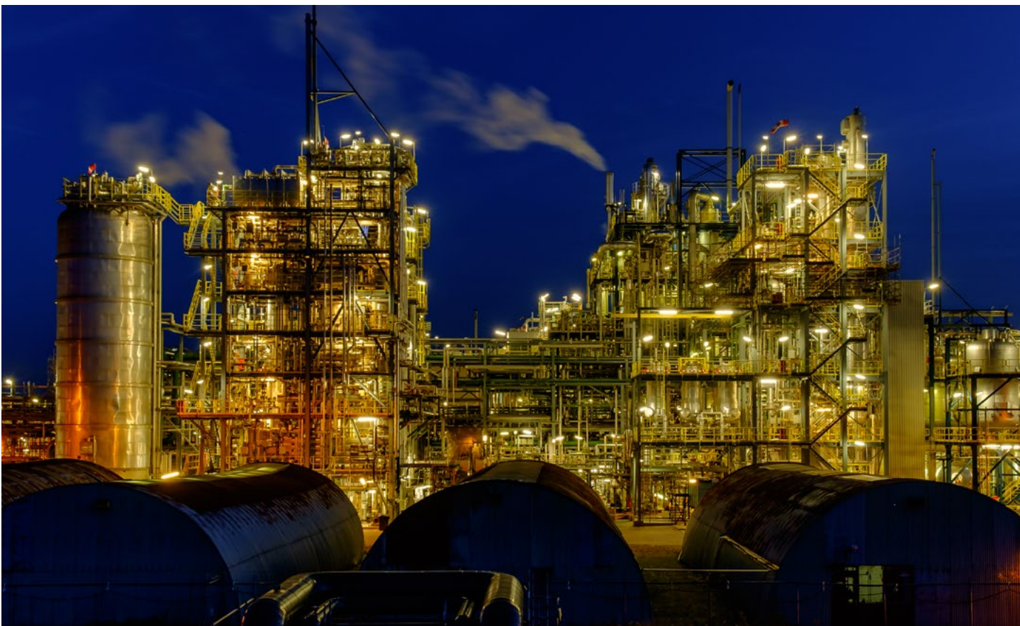
De haven van Delfzijl loopt voorop in de verduurzaming van de industrie.

Dit maakt Noord-Nederland zeer kansrijk voor het realiseren van een systeemtransitie. Hiermee kan een belangrijke bijdrage worden geleverd aan het halen van de klimaatdoelen voor Nederland als geheel, competitief voordeel in Europa (tijdens het opstarten Nederland/Groningen als gids; op lange termijn in een importsysteem als kennis en innovatiehub). Bovendien biedt het een groen groeiperspectief voor de regio.