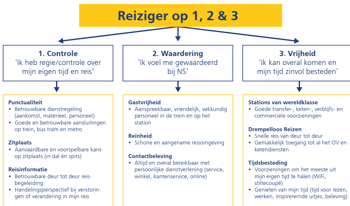
Figuur 1: Onze prestaties op bovenstaande negen thema's bepalen gezamenlijk het algemeen klantoordeel.

We streven naar zowel het verbeteren van zowel de prestaties op de satisfiers als het op peil houden van het prestatieniveau voor de dissatisfiers . Daarbij zijn keuzes nodig om het spoorvervoer van hoge kwaliteit te laten blijven voor onze reizigers en tegelijkertijd ook betaalbaar te houden. Op die manier werken we aan het realiseren van de doelstellingen op alle prestatie-indicatoren, waaronder het algemeen klantoordeel. In de volgende paragrafen zetten we per thema uiteen wat de relatie is met de klanttevredenheid en wat we doen om de tevredenheid van onze reizigers op peil te houden. 29