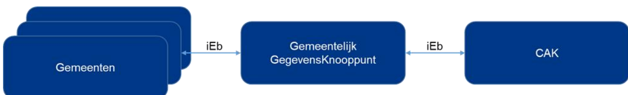
Figuur 1 Gegevensuitwisseling per 1 januari 2022

De uitvoering van de bijdrageregeling Wmo beschermd wonen is een verantwoordelijkheid van gemeenten en het CAK. Binnen het sociaal domein van de Wmo-keten is gegevensuitwisseling volgens iStandaarden gebruikelijk. Het ligt dan ook voor de hand dat het CAK voor Wmo beschermd wonen hierop aansluit. Daarmee kan eveneens worden aangesloten op bestaande infrastructuur waarin gebruik wordt gemaakt van het Gemeentelijk Gegevensknooppunt (GGk). Doordat in de nieuwe situatie alleen gemeenten en het CAK gegevens uitwisselen, lopen administraties minder snel uit elkaar en kunnen de tweemaandelijks bestandvergelijkingen worden vereenvoudigd. Zie het hoofdstuk 'Impact op de keten' voor een nadere toelichting.