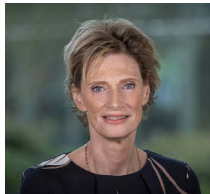
Alida Oppers Inspecteur-generaal van het Onderwijs

Juist onder de omstandigheden waarmee we nu te maken hebben, is de vraag wat de rol van de inspectie is. Die blijft: beoordelen, informeren, agenderen, activeren en soms ook interveniëren en aanjagen. Eraan bijdragen dat alle betrokkenen hun rol en hun verantwoordelijkheid nemen. Denkend vanuit het onderwijsstelsel en interveniërend daar waar dat het meeste nodig is. Dat deden we ook in 2020, met alle beperkingen die er waren. In dit jaarverslag verantwoorden we ons over ons werk in het voorbije jaar. In getallen en in een aantal belangrijke ontwikkelingen.