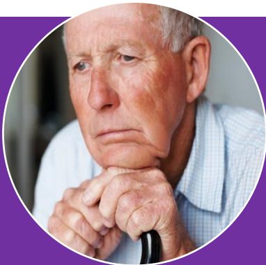
Meneer Brain (77)

Ervaren ernstige klachten in verschillende domeinen