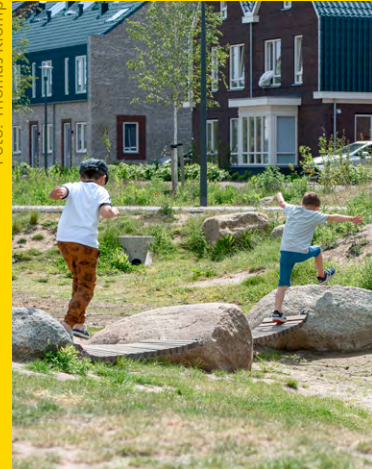
Groene, speelbare waterberging in Nijkerk