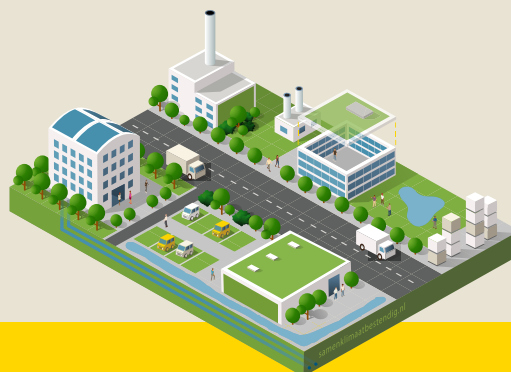
Illustratie: Mischa Pranger

Samen Klimaatbestendig werkt samen met enkele overheden, kennisinstellingen en de stichtingen Steenbreek, Clok en Kennisalliantie Bedrijventerreinen Nederland (SKBN) aan bewustwording en maatregelen. Vanuit de thema's klimaatadaptatie, groen en economie bouwen we aan een nieuwe community. We bundelen de kennis en wisselen succesvoorbeelden uit. Bij overheden legden we verbindingen tussen klimaatdeskundigen en de economie afdelingen. Ook ontwikkelden we handvatten voor de publiek-private aanpak. We zien dat de belangstelling voor groenblauwe bedrijventerreinen nu sterk groeit.