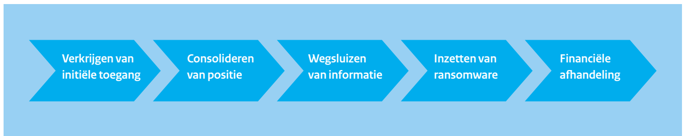
Figuur 1: De ransomware kill chain

Ook hier is diversificatie en specialisatie zichtbaar. Elke stap in deze ransomware kill chain kent specialisten die dit ofwel als dienst aanbieden, of samenwerken met andere specialisten om zo zeer effectieve, gecombineerde aanvallen uit te voeren.