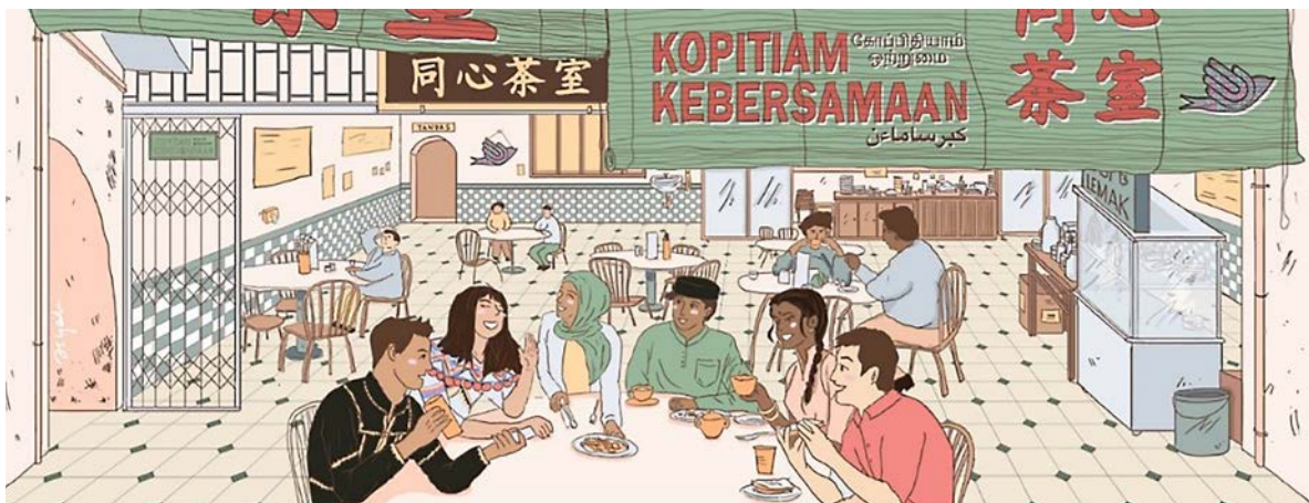
Campaign poster - Freedom of Religion or Belief and Expression Maleisië

In 2020 heeft de ambassade in Maleisië zich ingezet voor een progressievere discours over religieuze vrijheid onder jongeren. Nederland heeft op positieve wijze aandacht gegenereerd voor dit gevoelige onderwerp. Bewustwording van waarden zoals non-discriminatie, geweldloosheid, respect en het bevorderen van tolerantie tussen de verschillende etnische en religieuze groepen stond hierbij centraal. In samenwerking met verschillende organisaties, activisten en academici organiseerde de organisatie Komuniti Muslim Universal acht webinars waar sprekers met verschillende religieuze achtergronden werden samengebracht. Centraal tijdens deze webinars stonden verschillende onderwerpen gerelateerd aan religieuze vrijheid, geloof en expressie. In een van deze sessies werd specifiek aandacht besteed aan het recht om niet te geloven. Met de webinars werden in totaal meer dan 2000 personen bereikt. Een educatieve campagnevideo resulteerde tevens in een partnerschap met twee grote universiteiten in Maleisië. Zo wordt met de University Malaya een module opgezet voor academische doeleinden met focus op interculturele en interreligieuze educatie. In Tbilisi, Georgië, heeft Nederland bijgedragen aan de