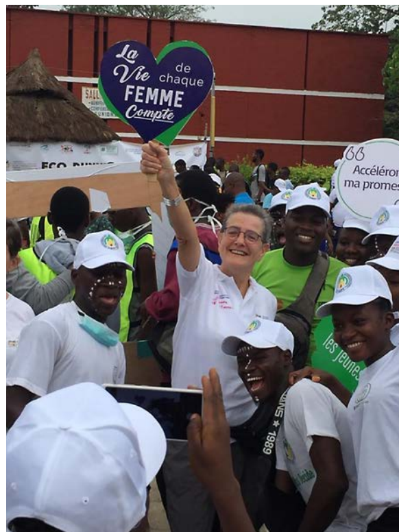
De Nederlandse ambassadeur in Benin loopt samen met een groep jonge SRGR-activisten mee aan een mars voor Internationale Vrouwendag.

In het najaar werd het nieuwe ambitieuze Europese Gender Action Plan (GAP III) gepresenteerd, het beleidskader om gendergelijkheid en toegang tot gelijke rechten voor vrouwen en meisjes te vervlechten in het bredere buitenlandbeleid van de EU. Omdat Nederland met een groot aantal gelijkgezinde EU-landen voet bij stuk hield voor wat betreft verwijzingen naar o.a. gendergelijkheid, de Istanbul Conventie en SRGR, bleek het niet mogelijk om raadsconclusies overeen te komen. Daarom volgde het Duitse voorzitterschap met sterke voorzitterschapsconclusies. Deze werden door 24 EU-lidstaten (exclusief Polen, Hongarije en Bulgarije), waaronder Nederland, gesteund. In de voorzitterschapsconclusies wordt bevestigd dat gendergelijkheid en toegang tot gelijke rechten voor vrouwen en meisjes de kern van de Europese waarden vormen. Het gebrek aan consensus zal de uitvoering van GAP III niet in de weg staan.