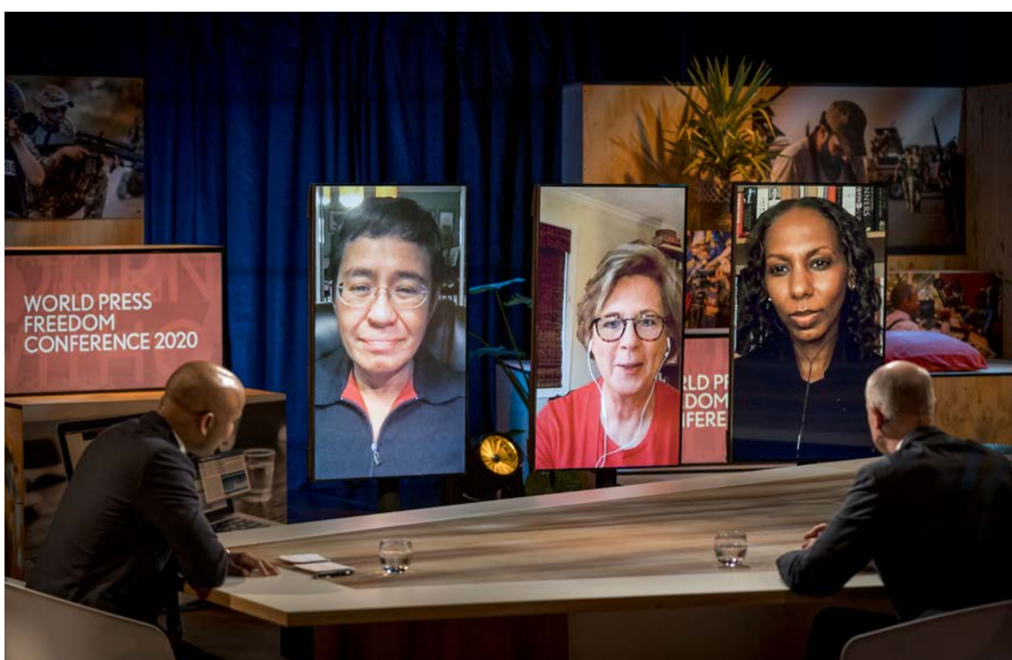
Wereldwijde opening van de World Press Freedom Conference 2020 : Setting the Scene for #PressFreedom met de talkshow: Stories from Frontline Champions of Press Freedom . Van links naar rechts: Humberto Tan (presentator), Maria Ressa (oprichter and eindredacteur Rappler), Elisabeth Bumiller (assistant-hoofdredacteur van The New York Times ), Nima Elbagir (senior correspondent CNN), Stef Blok (vml. minister van Buitenlandse Zaken en gastheer van de conferentie).

De World Press Freedom Conference heeft de Gouden Giraffe Event Award gewonnen van de Event Branche in de categorie Congressen & Kennis Events. Vanwege het innovatieve karakter heeft nu ook de SGVN interesse het concept van de conferentie te gebruiken voor de vormgeving van de aankomende AVVN.