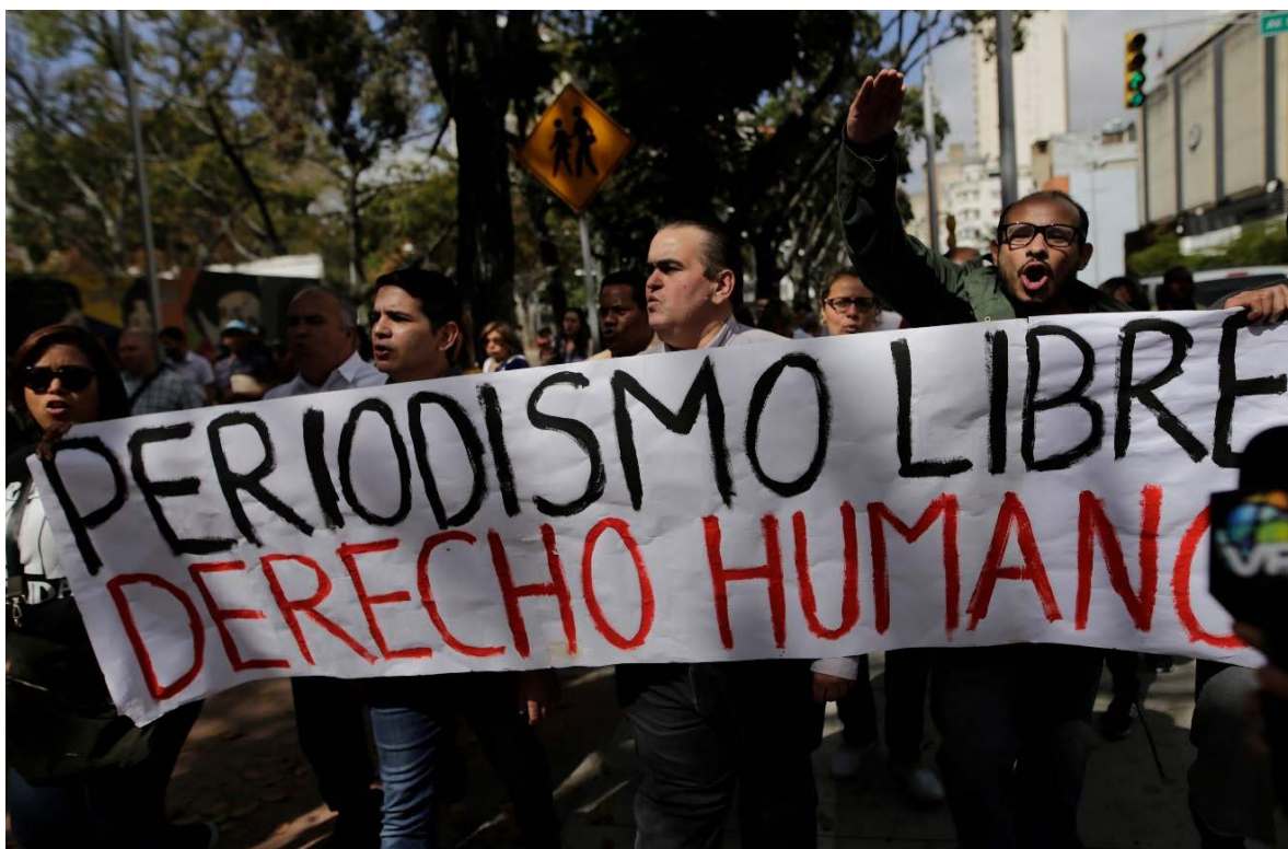
Manifestatie in Venezuela tegen aanvallen op journalisten door paramilitaire groepen in 2020.

Nederland werkte samen met FPU aan het creëren van een veilige omgeving waarin journalisten hun werk kunnen doen. Om te zorgen dat journalisten beschermd worden en hun werk kunnen voortzetten na geweld of intimidatie, heeft FPU het Reporters Respond noodfonds voor journalisten opgezet, met steun van Nederland. Via dit noodfonds zijn sinds de oprichting in 2011 in totaal 693 journalisten direct ondersteund. Helaas neemt de vraag alleen maar toe: in 2020 alleen al zijn 162 journalisten in nood geholpen. FPU steunde journalisten via het noodfonds met de betaling van reis- en kosten voor levensonderhoud, advies over digitale of fysieke veiligheid zoals een veilige VPN-verbinding, medische en psychologische hulp, en beschermingsmiddelen (vooral tegen COVID-19).