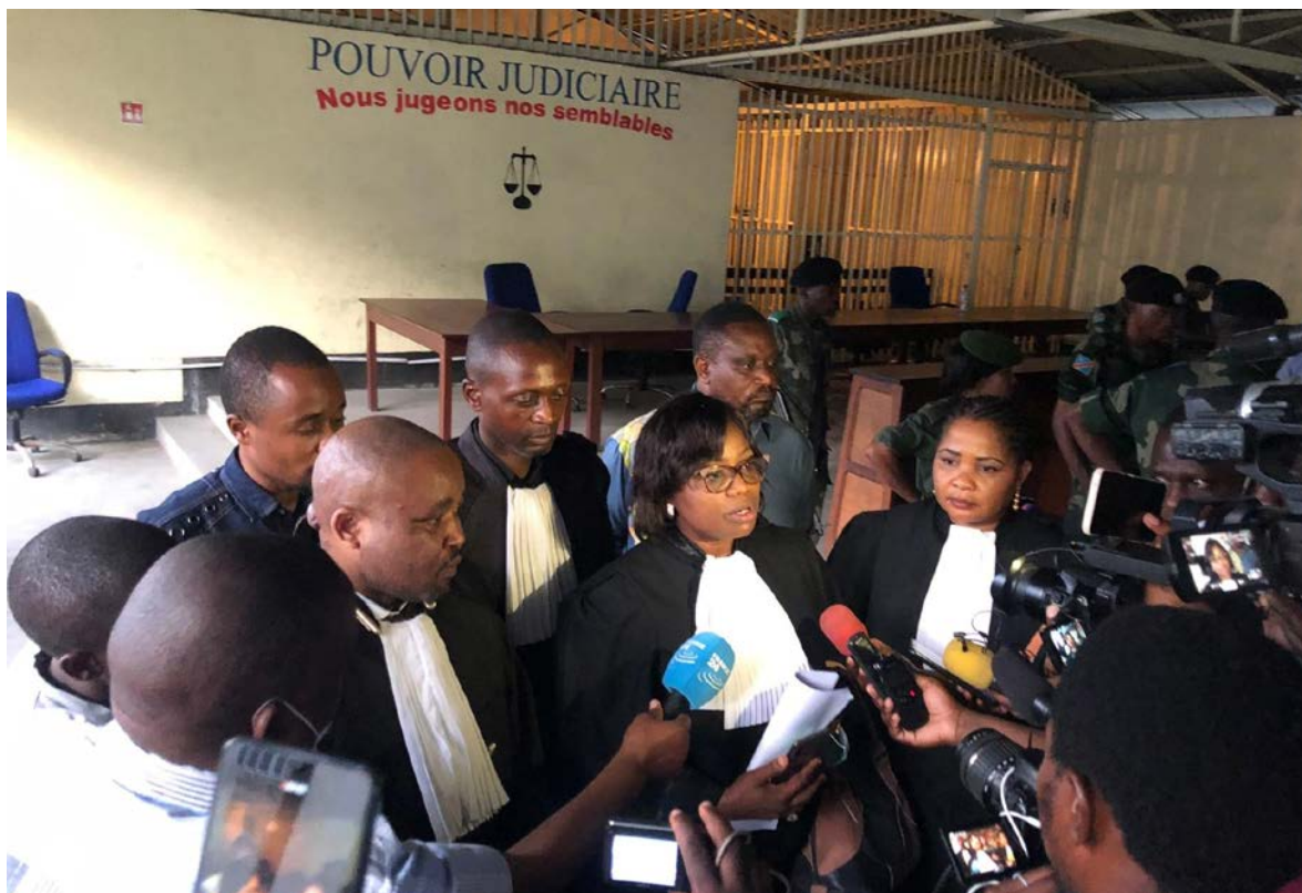
Via de organisatie TRIAL werden magistraten en advocaten getraind in de Democratische Republiek Congo.

Het Nederlands Forensisch Instituut bood in 2020, net als voorgaande jaren, op verzoek expertise aan ter ondersteuning van forensische onderzoeken wereldwijd. Dat kan gaan om verzoeken van het Internationaal Strafhof of andere hoven en tribunalen die forensisch bewijs vragen, maar ook van specialistische organisaties zoals de bewijzenbank voor Syrië.