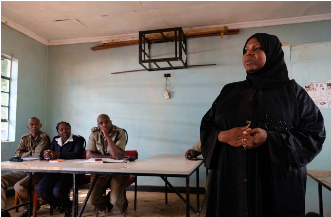
Vrouwen, jongeren, religieus leiders en lokale politie in dialoog in Kwale, Kenia, om onderling vertrouwen tussen christenen en moslims te stimuleren en veiligheid te vergroten.

Om radicalisering tegen te gaan en interreligieuze tolerantie te stimuleren, is onder andere het Women of Faith Network – bestaande uit een zestigtal vrouwelijke religieus leiders van verschillende religieuze instanties – opgericht. Naast preventie van radicalisering is dit netwerk actief op het terrein van religie en vrouwenrechten. Zo spreken ze onder andere op lokale radiostations om bewustwording over deze thema's te vergroten. Met Nederlandse steun werkt Mensen met een Missie samen met deze lokale leiders en partners om wederzijds begrip te creëren en op de lange termijn bij te dragen aan mensenrechten, vrede en veiligheid in plekken zoals Mombassa.