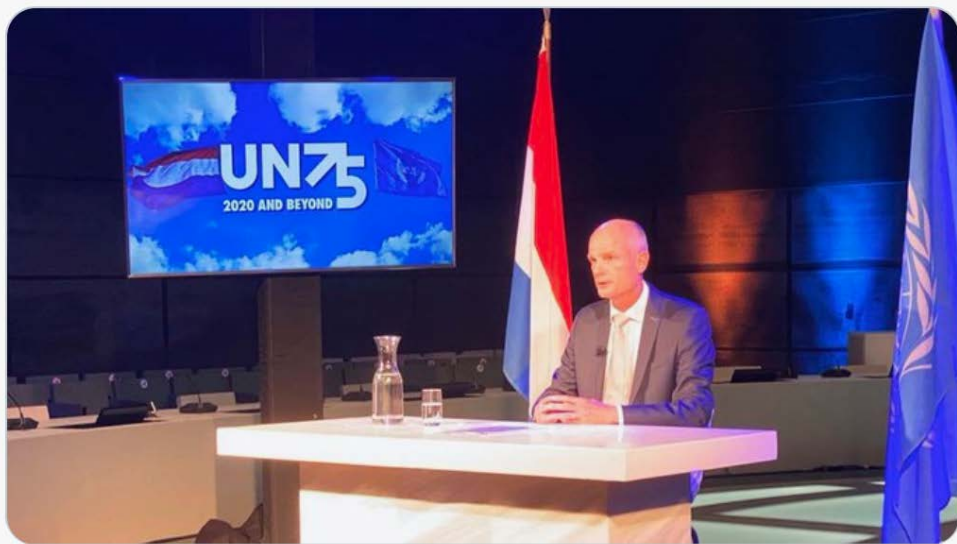
Minister Blok, vml. minister van Buitenlandse Zaken, bij het door Nederland georganiseerde evenement over Syrië tijdens de ministeriële week van de AVVN.

The horrific crimes of the Assad regime cannot go unpunished. Very glad with the support we got during the #UNGA event I just hosted. Discussed our step to hold Syria to account, national prosecution, the importance of evidence and a victim-centered approach.