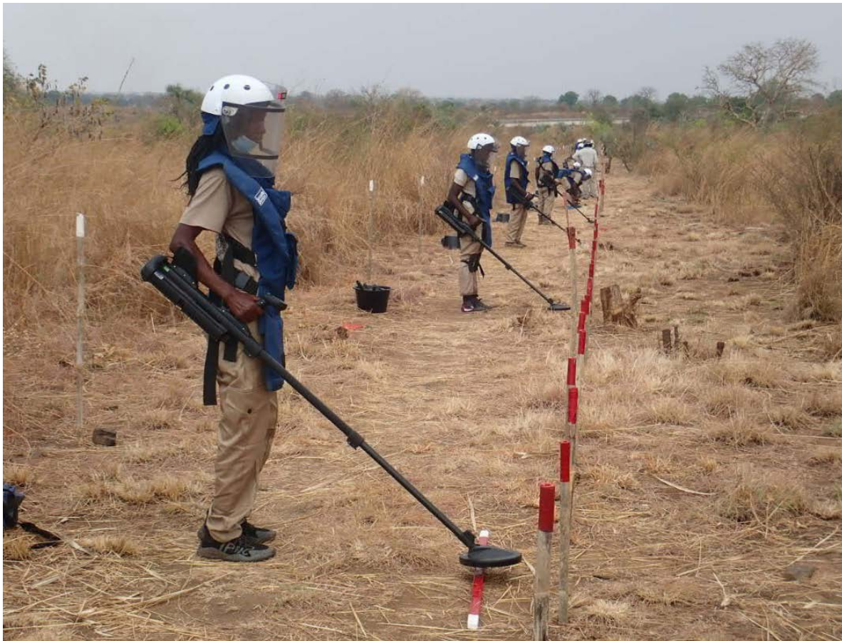
Vrouwen in Zuid-Soedan leren ontminnen. In 2020 werkte Nederland samen met partners MAG, DCA en DDG die mijnen ruimden en slachtoffers hielpen hun leven weer op te pakken. Zo worden gebieden weer leefbaar gemaakt voor burgers.