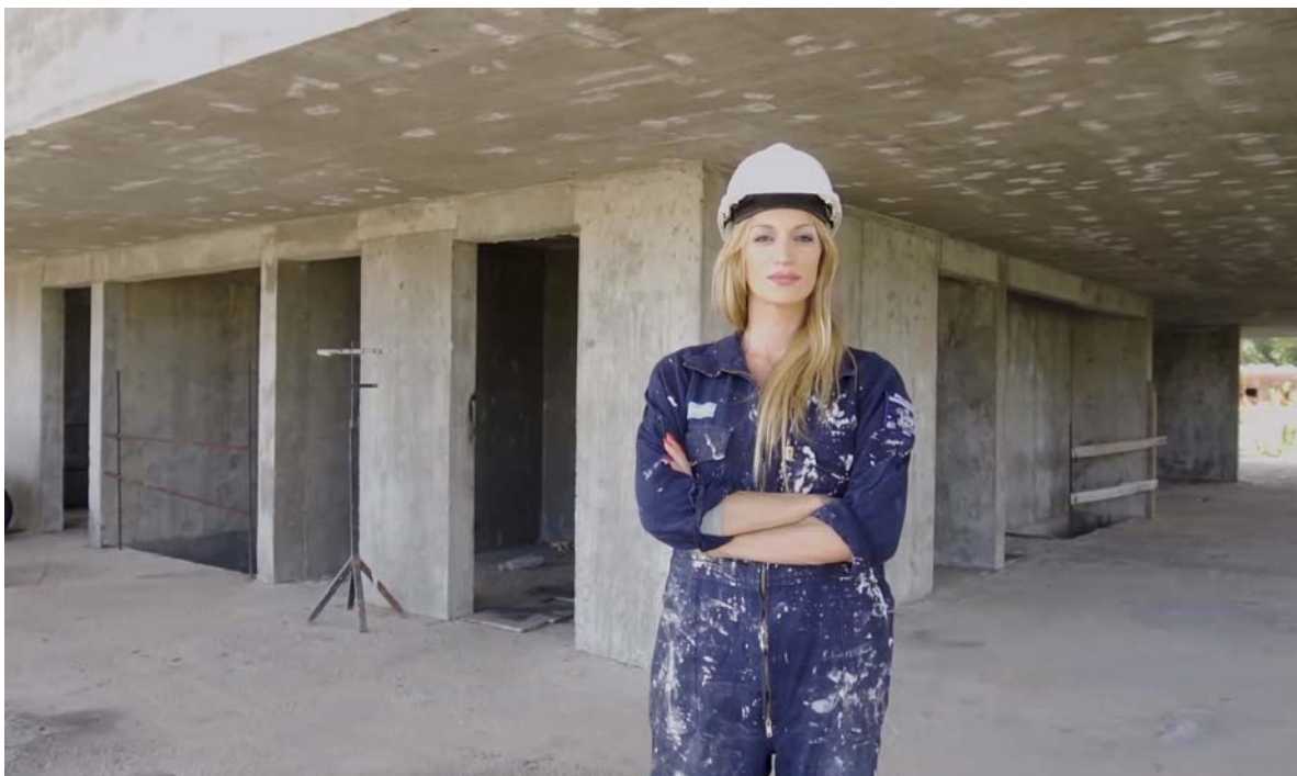
Fotostill uit de promotiefilm van het Argentijnse initiatief Contratá Trans , dat de baankansen van transgenderpersonen helpt vergroten.

Ook de voorbeelden van projecten gericht op het tegengaan van discriminatie van LHBTI's zijn talrijk en variëren van het bestrijden van discriminatie in de gezondheidszorg tot op de werkvloer. In Colombia werd een netwerk van 26 transgenderpersonen opgezet dat werd opgeleid om andere transgenderpersonen te begeleiden bij toegang tot de Colombiaanse gezondheidssector. Een sector die erg vijandig staat tegenover transgenderpersonen, en slecht is ingespeeld op hun zorgbehoeften. Het netwerk is erin geslaagd een gesprek te voeren met aanbieders van gezondheidszorg over toegang tot goede gezondheidszorg voor transgenderpersonen. De betrokken organisatie ontwikkelde een digitale training over het onderwerp die meer dan 33.000 keer werd bekeken. In Argentinië werd het project Contratá Trans gefaciliteerd dat de baankansen van transgenderpersonen helpt vergroten. Via het project werd een onlinecursus ontwikkeld voor overheidspersoneel en het bedrijfsleven over diversiteit en inclusie op de werkvloer waaraan 9.000 mensen deelnamen. Daarnaast werd een platform opgericht voor werkzoekende transgender personen waarmee meerdere transgenderpersonen een baan vonden.