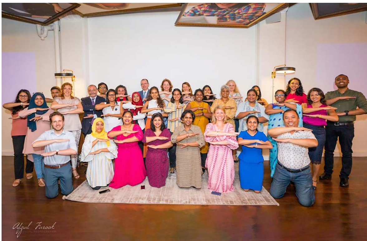
Tijdens Internationale Vrouwendag organiseerde de ambassade in Sri Lanka SPEAKUP! Talks, waarbij de kracht van storytelling centraal stond. Deelnemers konden hier in een veilige omgeving hun ervaringen uitwisselen en leerden over het doorbreken van taboes.

viering van 16 Days of Activism Against Gender-Based Violence . Een op de drie vrouwen in Zimbabwe krijgt te maken met seksueel of gender-gerelateerd geweld. In samenwerking met lokale organisaties werd de inzet geëerd van 16 vrouwen, mannen en instituties voor de bescherming van de rechten van vrouwen en meisjes in Zimbabwe. Zogenaamde 'gender kampioenen' werden gekozen uit meer dan 200 kandidaten uit het hele land. De ambassade toonde op sociale media 16 dagen lang het inspirerende werk van deze voorvechters van vrouwenrechten. Voorts steunde de ambassade ieder van de kampioenen met een beurs van USD 5.000 om hun belangrijke werk uit te breiden. Daarmee kunnen zij in samenwerking met lokale gemeenschappen de strijd verder aanbinden met gender-gerelateerd geweld, kindhuwelijken voorkomen, en de autonomie van vrouwen