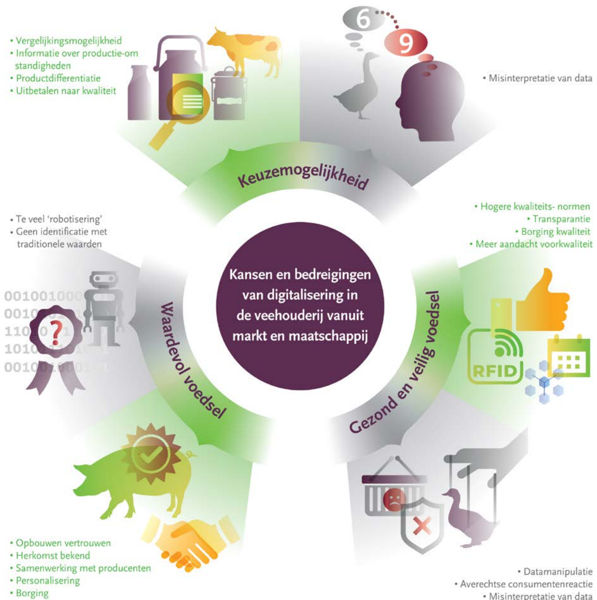
Figuur 3. Kansen en bedreigingen van digitalisering in de veehouderij vanuit markt en maatschappij.

Datamanipulatie vormt een bedreiging voor de gezondheid en veiligheid van ons voedsel. Het bewust zodanig doorgeven of beschikbaar stellen van data opdat een onjuist beeld wordt gegeven van de productieomstandigheden en/of de productkwaliteit en -samenstelling kan op vele manieren. Bijvoorbeeld door het benadrukken van goede aspecten van welzijn maar weglaten van negatieve aspecten op milieu. Waar in de stal hangen de sensoren die het klimaat meten, wat gebeurt er met een RFID-tag als een dier deze verliest, et cetera?