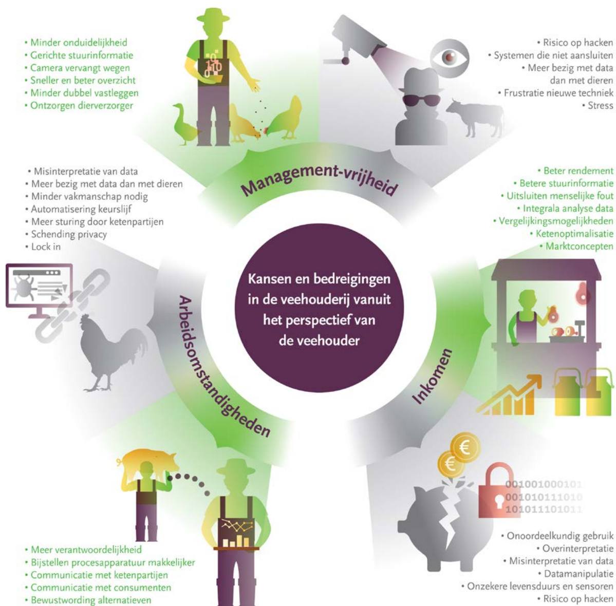
Figuur 2. Kansen en bedreigingen in de veehouderij vanuit het perspectief van de veehouder.