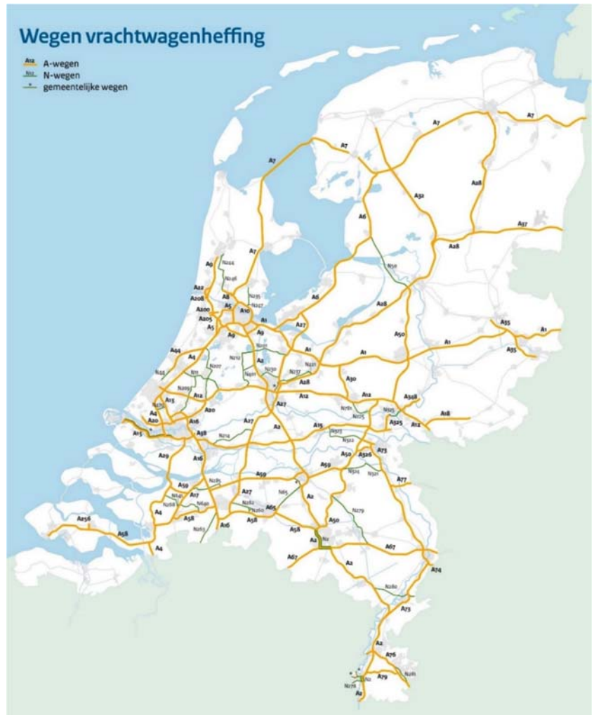
Figuur 2: Heffingsnetwerk van Nederland.